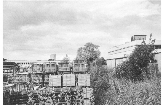
Fotomuseum Winterthur: Peter Piller aus Peripheriewanderung Winterthur , 2013/2014. C-Print, 30 × 40 cm

Salzburg Initiative Architektur Holz – Nachhaltiges Bauen in Finnland 18.2. bis 13.3. www.initiativearchitektur.at