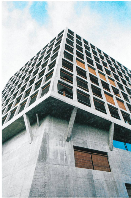
Den hohen Sockel des Hochhauses «Helsinki» im Basler Dreispitz bauten Herzog & de Meuron für ihr eigenes Archiv. → S. 22

Titelbild: «Display» bedeutet Auswählen, Präsentieren und Arrangieren. Hier mit einem Bild des Hauses Ganzendries von De Vylder Vinck Tailieu Architekten in der Ausstellung «Theatre Objects» im LUMA-Westbau, Löwenbräukunst in Zürich.