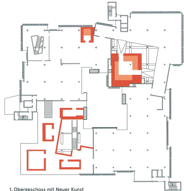
1. Obergeschoss mit Neuer Kunst