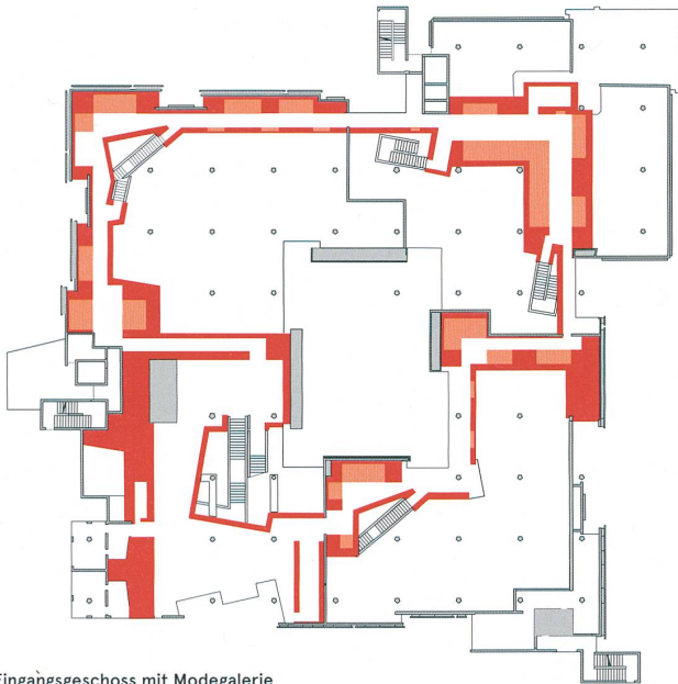
Eingangsgeschoss mit Modogalerie

Die eingestellten Räume beschützen lichtscheue Exponate und bieten direkte Begegnungsmöglichkeiten, die teils auch farblich herausgehoben sind.