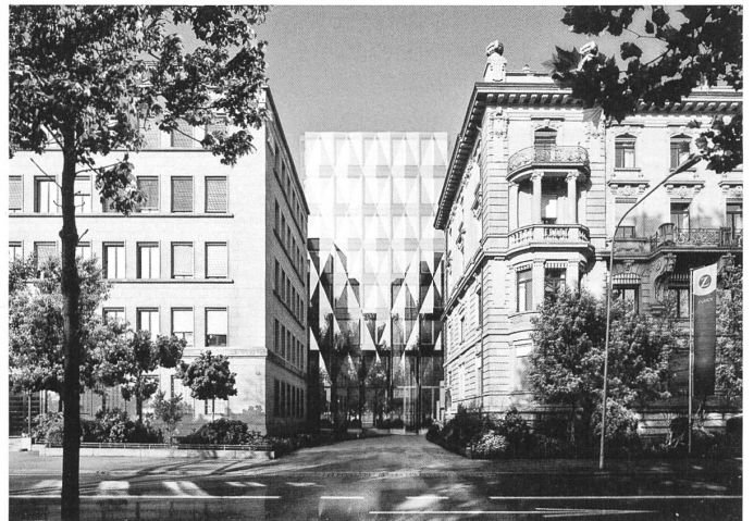
Die Zurich-Versicherung verpflichtet sich, gegen mehr Ausnützung einen Beitrag zur Erneuerung der Uferpromenade zu leisten. Perspektive des geplanten Erweiterungsbaus von Adolf Krischanitz.

Das Hochbaudepartement der Stadt Zürich und der Zurich-Versicherungskonzern zeigen nun, dass es auch anders geht. Die Zurich will ihren Konzernhauptsitz am See stark verdichten. Ein achtgeschossiger, U-förmiger Bürobau von Adolf Krischanitz wird das alte Hauptgebäude aus dem 19. Jahrhundert umrahmen und mit