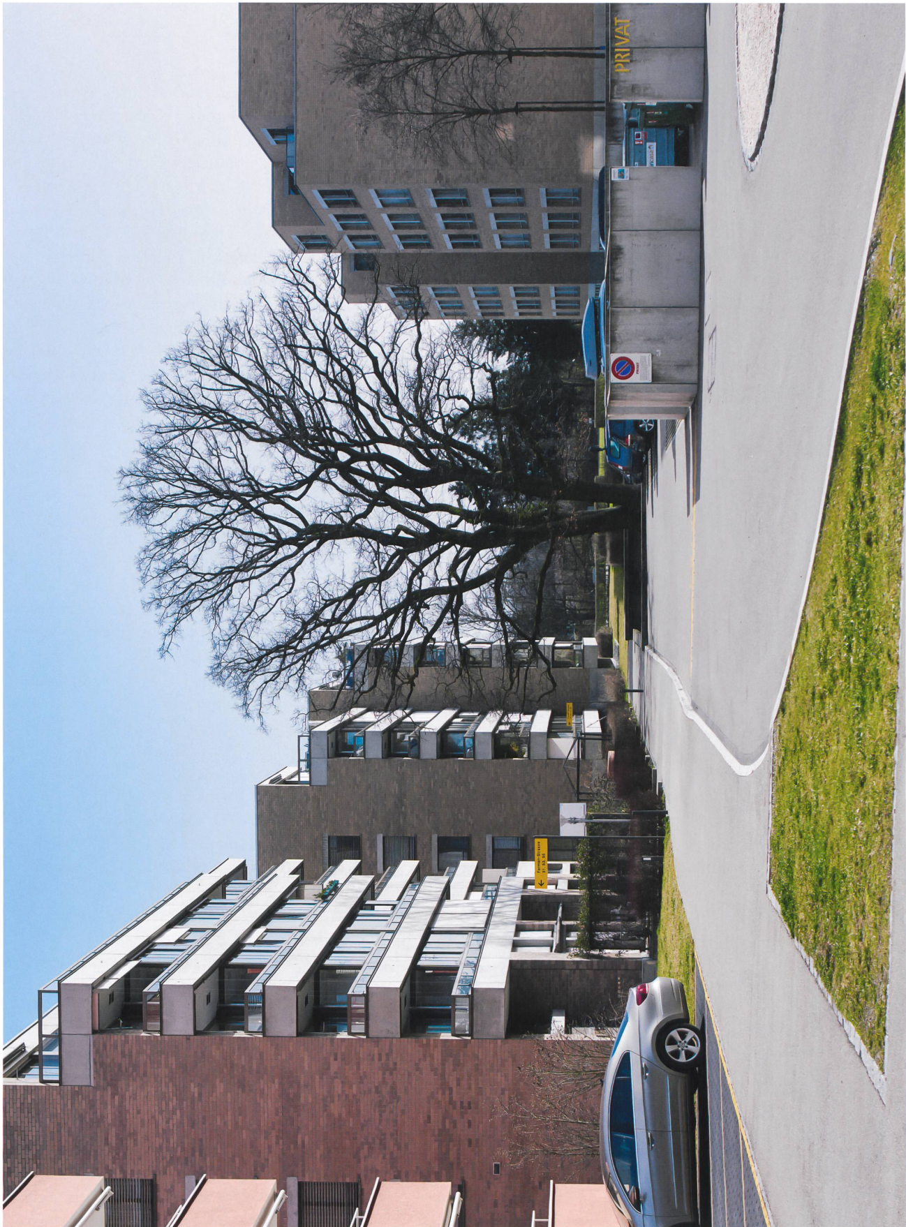
Ein Ort mit Ausstrahlung: Die alte Eiche am Ende der Fairmanstrasse, umgeben von der Überbauung Seeblick (von Ballmoos Kruecker 2007).