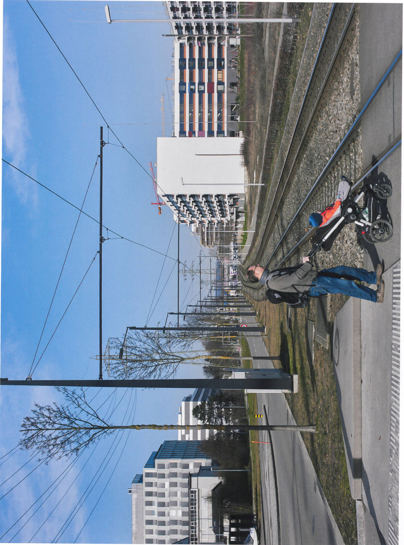
Schwierige Querung: Stadtgrenze entlang der Glattparkstrasse, Stadtbahntrasse, Strasse und seitliche Grünstreifen trennen den Glatt-