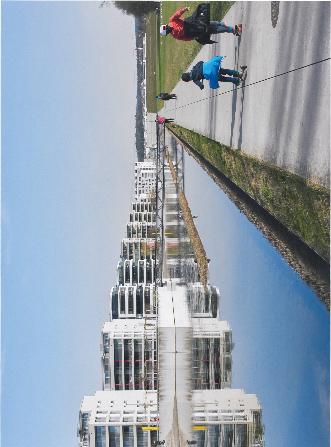
Weite der Landschaft: An den künstlichen See, der hauptsächlich von Meteorwasser gespeist wird, stossen die Zeilen der 1. (Hintergrund) und 2. Bauetappe des Quartiers Glattpark. Im Hintergrund verdeckt der Lärmschutzwall der Autobahn den Kern von Opfikon.