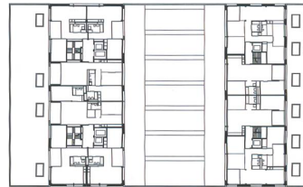
Wohnebene D mit überhohen Grosswohnungen