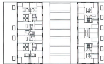
Wohnebene B mit Kleinwohnungen