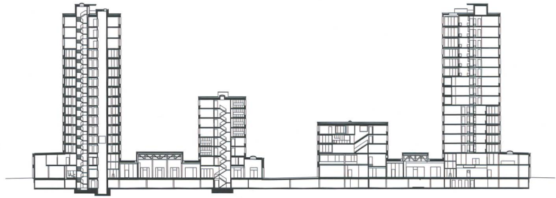
Längsschnitt: Die Weite des Gleisraums dringt bis ins Quartier