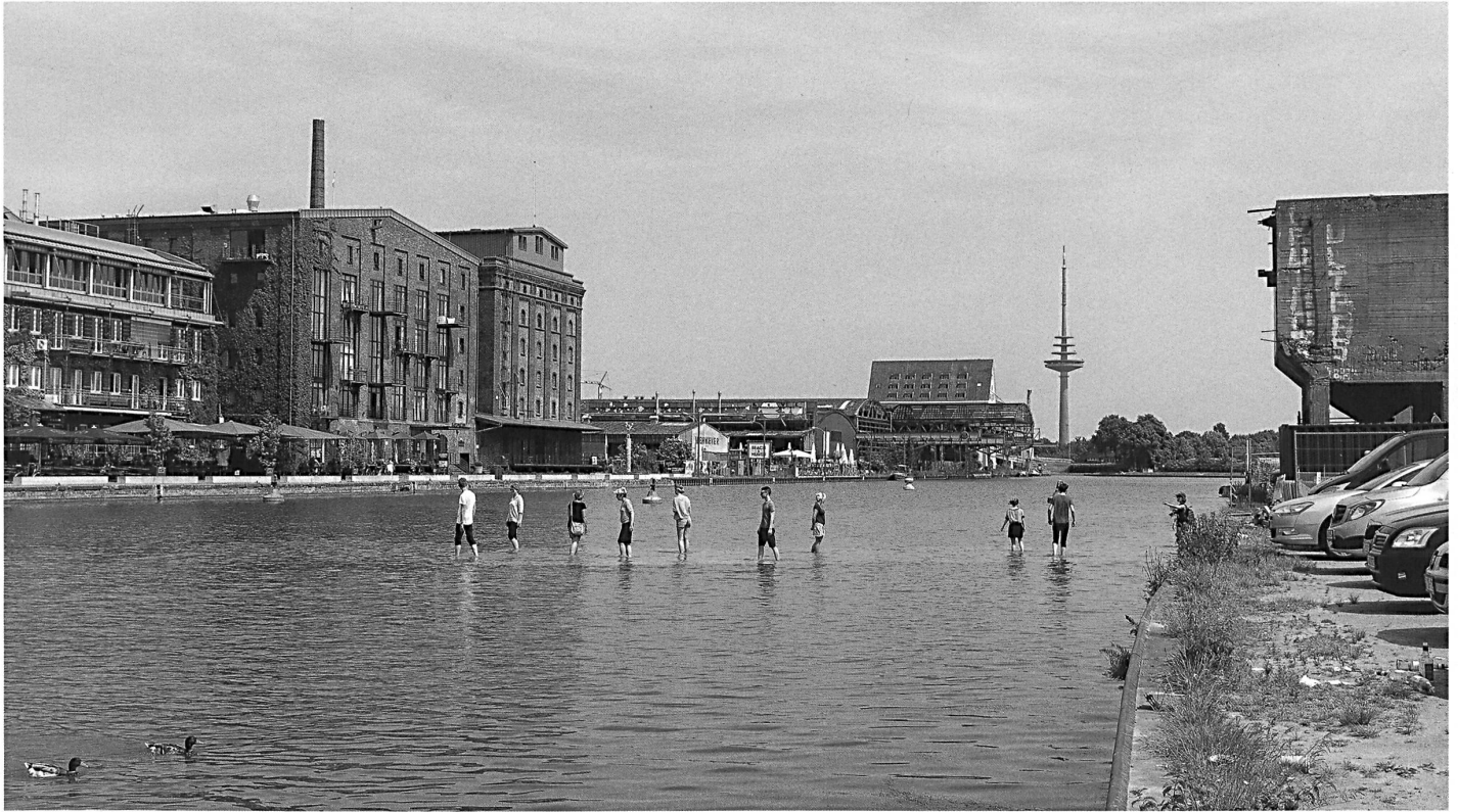
Ayşe Erkmen: Steg über den Binnenhafens: Erst die Besucher machen das Werk sichtbar.