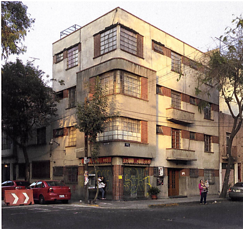
Mexiko galt in der Zwischen- und Nachkriegszeit des 20. Jahrhunderts als Land der Pioniere und der Hoffnung auf ein modernes Staatswesen; der Aufbruch äusserte sich in teils anonymer modernistischer Architektur.

äusserst lebendig – wie die Stadtbewohner selbst, die ihn einnehmen und als gemeinsames Gut betrachten.