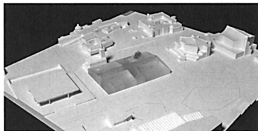
1. Preis Herzog & de Meuron Flachbau mit Satteldach mit öffentlicher Passage

Erwähnenswert ist neben der komplexen historischen Entwicklung auch das grossangelegte Wettbewerbsverfahren. Anders als beim Schweizerischen Landesmuseum, das dank eines vorgeschalteten Ideenwettbewerbs und zugeschalteten Stars für die zweite Runde gute Resultate zeitigte, wurde in Berlin das Ergebnis der ersten Stufe veröffentlicht. Zehn der 460 Eingaben empfahlen sich zur Teilnahme am Realisierungswettbewerb. Über eine Präqualifikation gesellten sich weitere 19 Teams aus Architekten und Landschaftsarchitekten hinzu. Zudem wurden 13 Architekturbüros direkt eingeladen. Auf dem Podium sind nur bekannte Namen. Die Herausforderung für die 42 Beteiligten war somit gross, genauso wie der