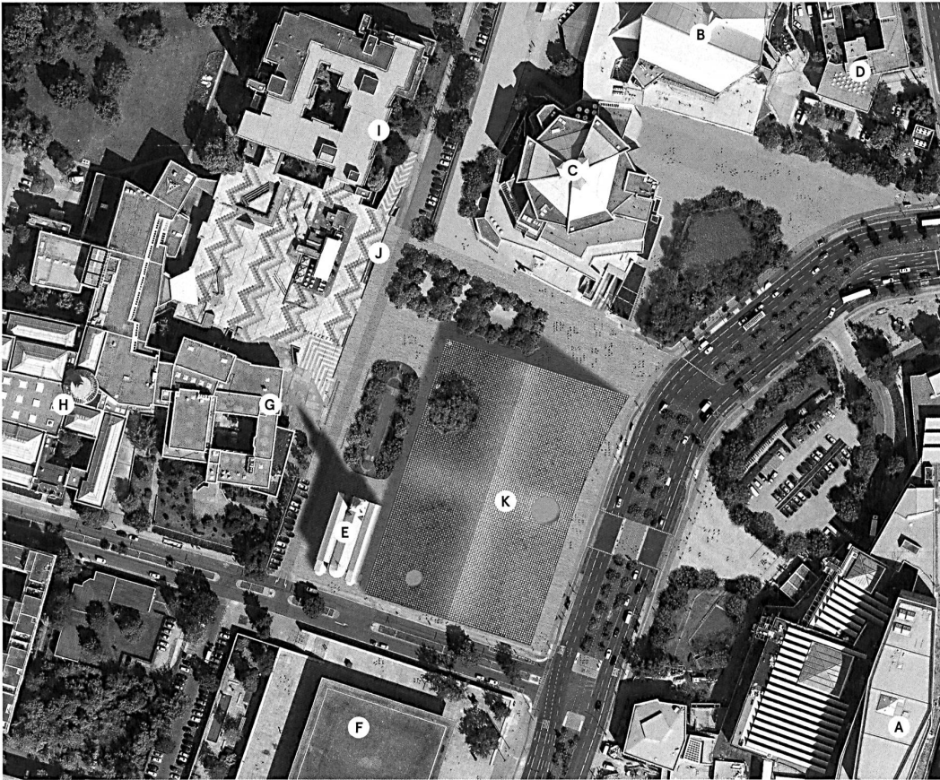
Der erste Preis von Herzog & de Meuron funktioniert wie eine überbaute Strassenkreuzung: Er verbindet Mies' Museum mit Scharouns Philharmonie, wie auch die Gemäldegalerie mit der Staatsbibliothek jenseits der Strasse.