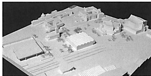
3. Preis Bruno Fioretti Marquez: Kompakte Box mit umlaufender Platzfolge