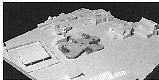
2. Preis Lundgaard & Tranberg Raumgreifende Amöbe mit zentralem Hof