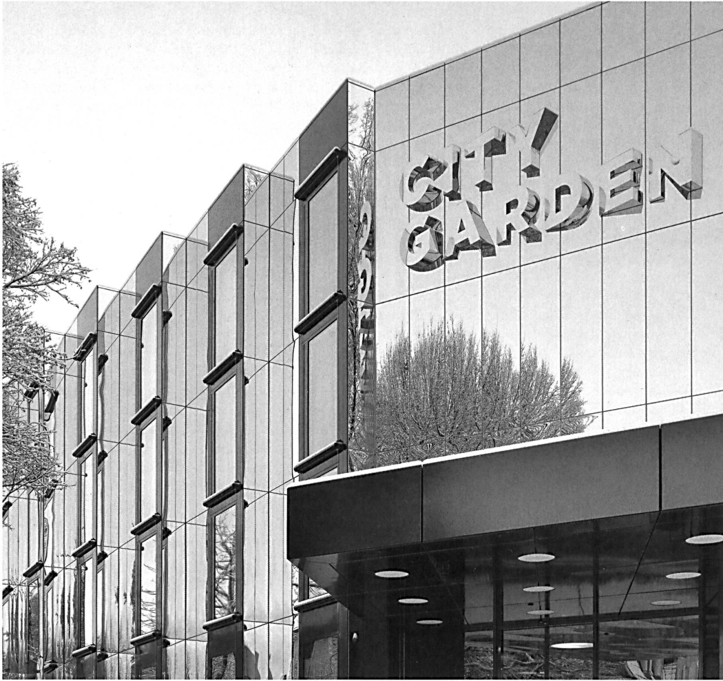
Die körperhafte Beschriftung ist in Ausdruck und Materialisierung von der Architektur nicht zu trennen: Hotel City Garden, Zug 2009. BIV Grafik, EM2N.

die dem vielgestaltigen Inhalt einen stringenten, luftigen und übersichtlichen Rahmen bietet.