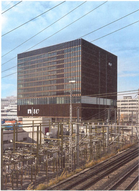
Der kolossale Kubus der Fachhochschule ist neuer Bezugspunkt über die Weite der Muttenzer Rangiergleise hinweg in die Basler Landschaft. → S. 58