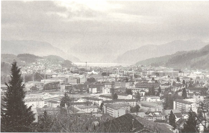
Blick über Luzerns Süden mit den Baustellen Mattenhof und Schweighof.