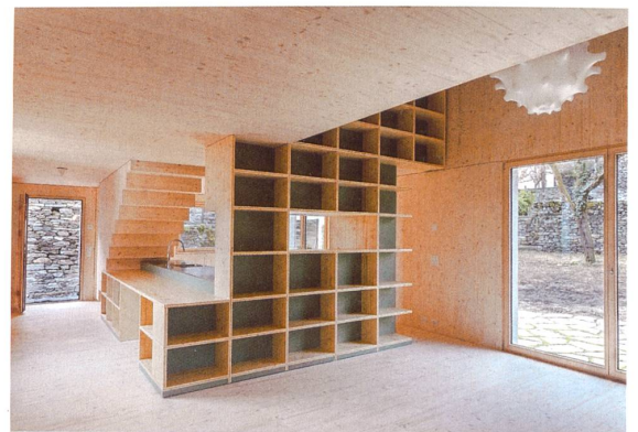
Innen gewinnt die massgeschneiderte Architektur maximale Räumlichkeit.