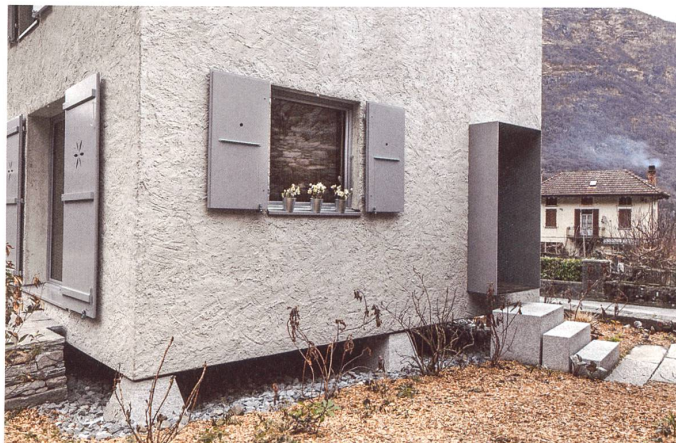
Das fragile Häuschen erscheint am Dorfeingang wie die veredelte Version der derben Rustici von nebenan.