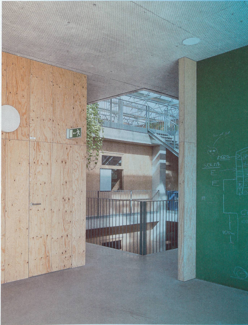
Klug moderiertes Innenklima im Agrarforschungsinstitut ICTA-ICP der Universität Autònoma de Barcelona von HArquitectes und DATAE 2014.

«Das Gebäudeklima muss Teil der Architektur bleiben und sich aus architektonischen Entscheidungen herleiten.»