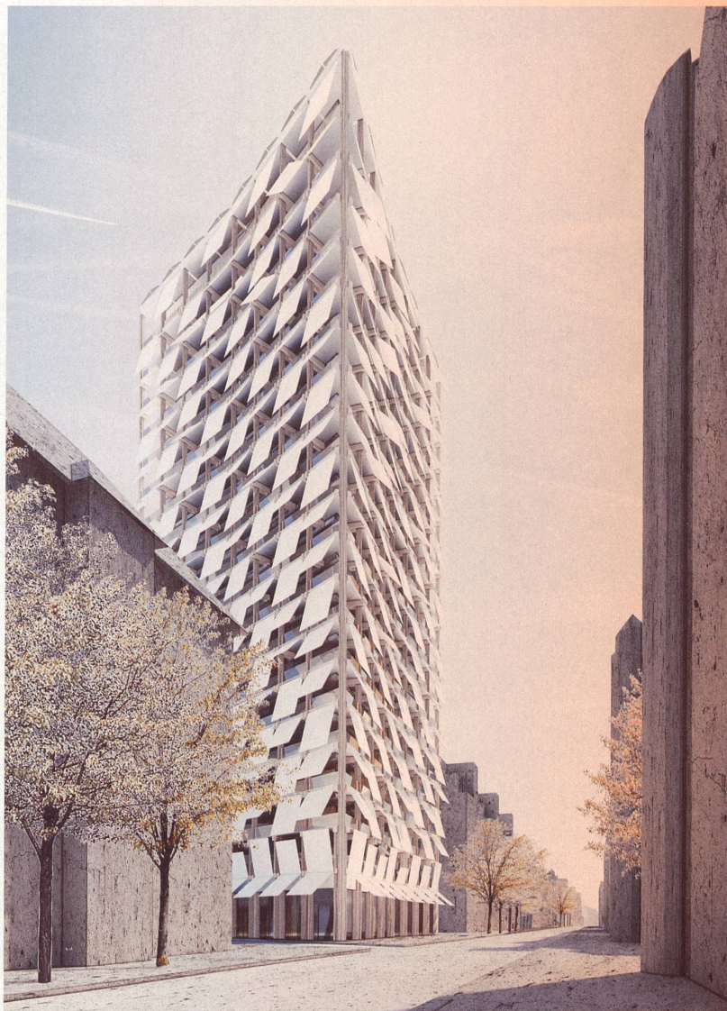
Neue Paradigmen führen zu neuen Ausdrucksmöglichkeiten: Eine von vielen denkbaren postfossilen Architekturen. Freie Arbeit und Bild von JOM Architekten

«Konstruktive Verbindungen der Zukunft werden gesteckt, geklemmt und geschraubt – nicht geklebt, gemörtelt oder gegossen.»