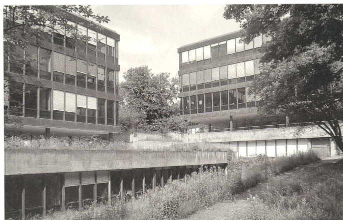
Porträt-Still aus dem Film Alain G. Tschumi – Construire pour un monde meilleur (oben). Schulcampus Linde in Biel (1975).