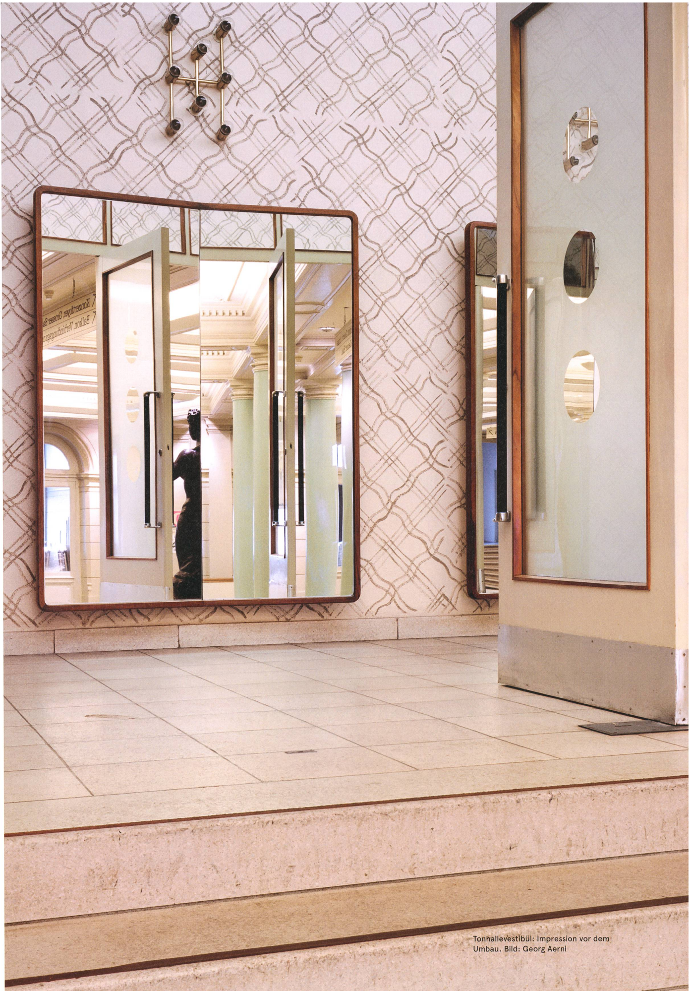
Tonhallevestibül: Impression vor dem Umbau.