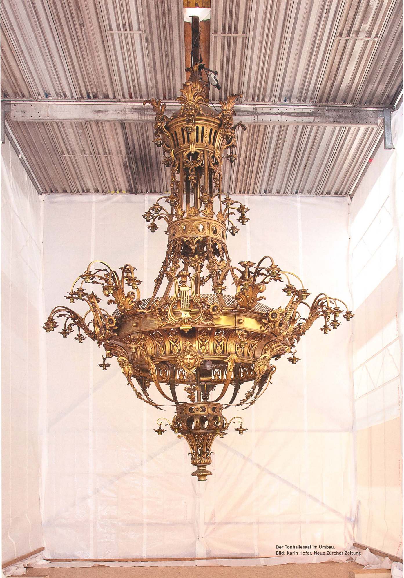
Der Tonhallsaal im Umbau.