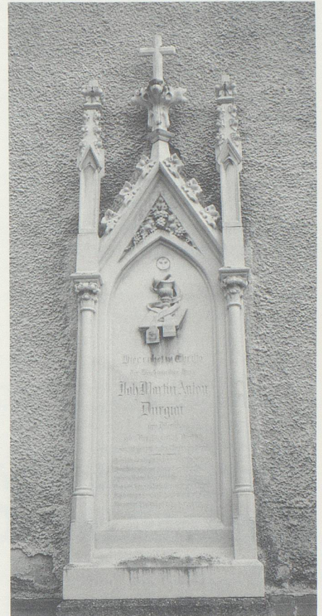
Durgiais Grabmal beim Hauptportal der Pfarrkirche.

Zunehmende Solidarität erfuhr Durgiai eigentlich erst nach der Konsekration. Und erst als der Tod den Gamsern ihren wohl bemerkenswertesten unter allen bekannten Pfarrherren entrissen hatte,