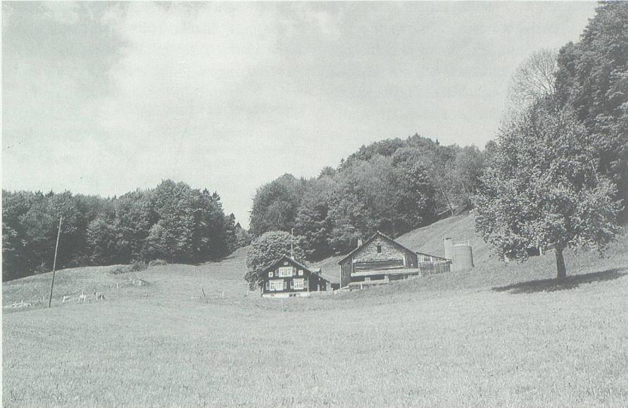
Heimwesen auf Mumpelin am oberen Grabserberg. Der romanische Name bedeutet «des Püulis Berg».