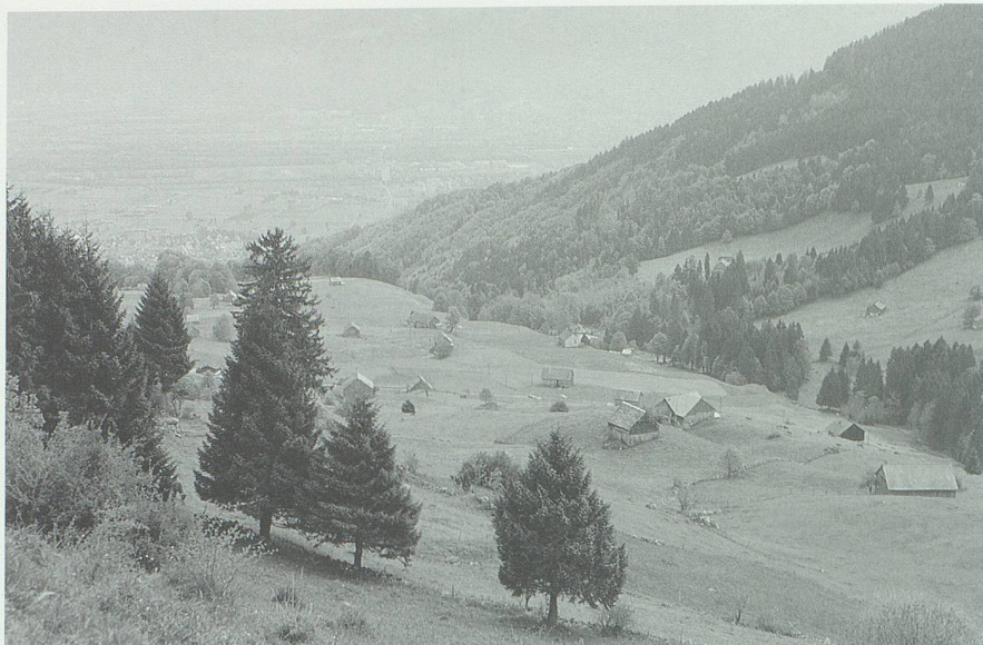
Am oberen Grabserberg. Blick über die Terrasse von Muntlerentsch. Dieser Name ist romanisch und bedeutet «des Lorenzen Berg».

Dann ist einiger gewichtigerer Einzelarbeiten zu gedenken, die den Familiennamen des St.Galler Oberlandes und Liechtensteins gewidmet sind; allen voran das Büchlein von Franz Perret Die Geschlech-