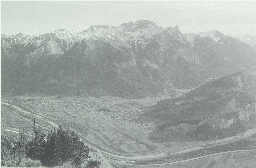
Das Rheinknie unter dem Ellhorn bei Mäls FL und Trübbach. In der Bildmitte rechts die Luziensteig; hier verlief zur Römerzeit die wichtige Strassenverbindung zwischen Bregenz und Chur.

in Gams), Dünser (Schaan: zum vorarlbergischen Dorfnamen Düns ), Ganser (urkundlich; zum Ortsnamen Sargans ). Bezug auf Weiler und blosser Geländeabschnitte nehmen etwa: Saxer (Sevelen: zum Flurnamen Sax in Buchs), Montaschiner (Werdenberg, urk.: zum unweit gelegenen Muntteschin ), Flater (Wartau urk.: zu Flat in Buchs/Sevelen), Furgler (Pfäfers: zu Furkels ebendort), Gubser (Quarten: zu Gubs Murg ), Müntener (Buchs: zu einem heute unbekanntem Flurnamen * Müntina oder * Muntina , wohl aus dem Raum Buchs), Quaderer (Schaan: zu Quader Schaan), Roduner (Sennwald: zu einer heute unbekanntem Örtlichkeit * Rodun[d] ), Muntlerentscher (Grabs urk.: zu Muntlerentsch Grabserberg), Stricker (Grabs: zu einer Örtlichkeit Strick bei Muntlerentsch am Grabserberg), Eggenberger (Grabs: zum Weilernamen Eggenberg am Grabserberg), Wenaweser (Schaan: zum Weilernamen Winnenwis am Grabserberg).