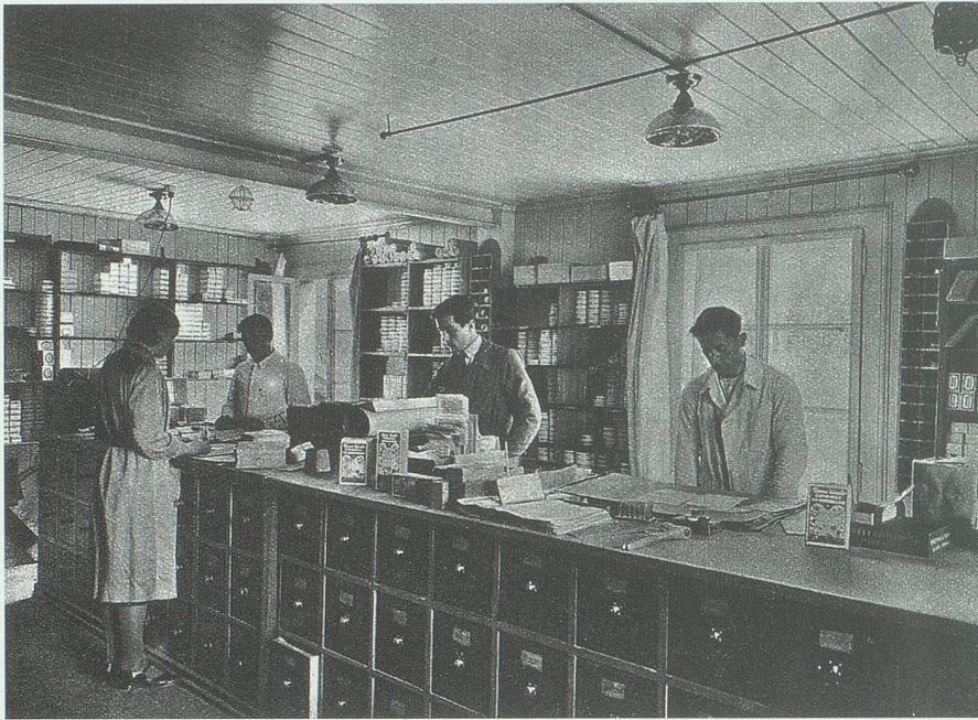
Die Spedition im Depot der Kräuterpfarrer Künzle AG in Zizers.

aber nennenswerter Teil der Spitalmedizin für die Anwendung alternativmedizinischer Heilverfahren in Frage.