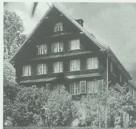
Das Bad Gams um 1905.