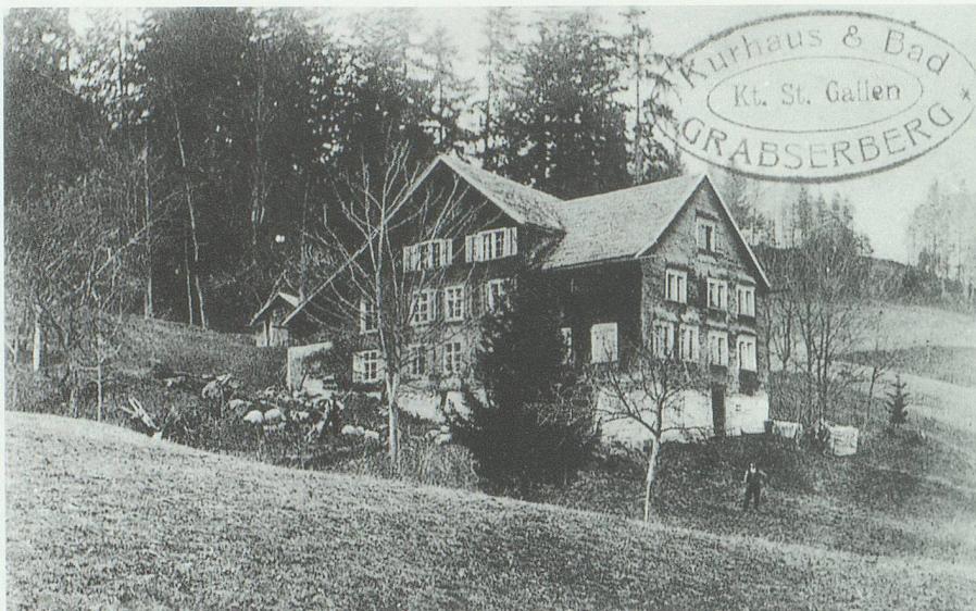
Das Bad Grabserberg vor dem Bau der Strasse, die heute an der Liegenschaft vorbeiführt.

der Badepreis einen Franken. Sowohl vom Bahnhof Buchs als auch vom Toggenburg her erfolgten täglich viermal Postfahrten mit Halt im Schutzgunten. Das Gepäck war an das Zollhaus Gams zu adressieren. Die Anwendung des Wassers, sowohl äusserlich wie auch innerlich, entsprach 1912 immer noch derjenigen des vorigen Jahrhunderts. Und weil das Abwasser in die Simmi geleitet wurde, soll auch das Baden in diesem Bergbach ein Allerweltsheilmittel gegen äussere Wunden wie Schürfwunden und andere leichte Blessuren gewesen sein.