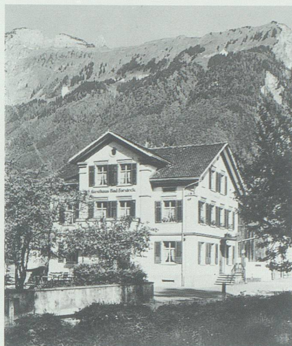
Das Bad Forsteck, als es 1928 von Jakob Gantenbein gekauft wurde.

In einer Publikation von 1855 werden auf einem beigelegten Plan im Massstab 1:200 000 viele Mineralquellen aufgeführt, darunter diejenigen des Bades Pfäfers, jedoch keine aus dem Werdenberg. Die Artikel befassen sich mit der Temperatur und den Bestandteilen des Wassers. Im Text hingegen werden unter Schwefelwasserquellen «Grabs, Sax [hier dürfte es sich um Forstegg handeln], Ransbad, Gempe-