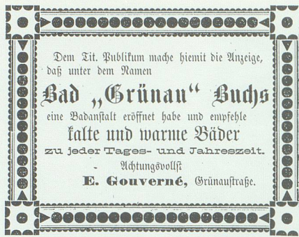
Inserat aus dem Jahre 1888 im «Werdenberger & Obertoggenburger».

gästen unter anderem Heissluft-Schwitzbäder.