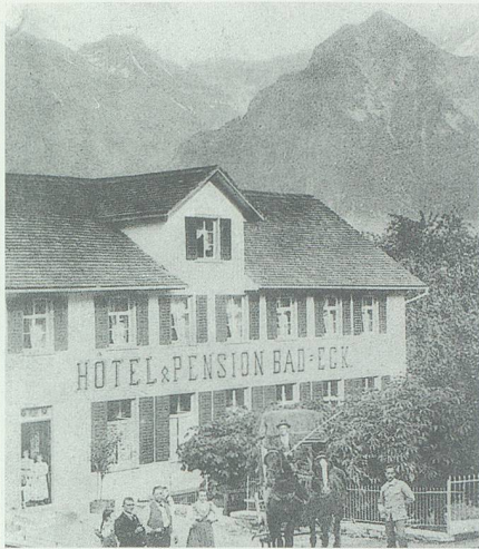
Das Bad-Eck vor 1900. Die Gäste wurden mit dem Wagen in Trübbach abgeholt.

nicht, entzieht sich meiner Kenntnis. Über den Sommer 1941 wurde das Bad-Eck umgebaut und erhielt den Namen Rosenhalde. Damit gehörte auch die Oberschaner Badstube endgültig der Vergangenheit an. Das Aufkommen von Bad und Dusche in den Privathäusern sowie die Erstellung von Hallenbädern haben den Niedergang von kleineren Heilbädern und Badstuben