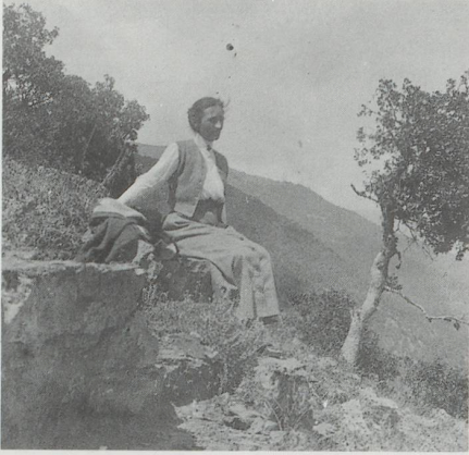
Rast im Sonnenglast. Mutter auf einer Wanderung in Erwartung des heimkommenden Gatten.