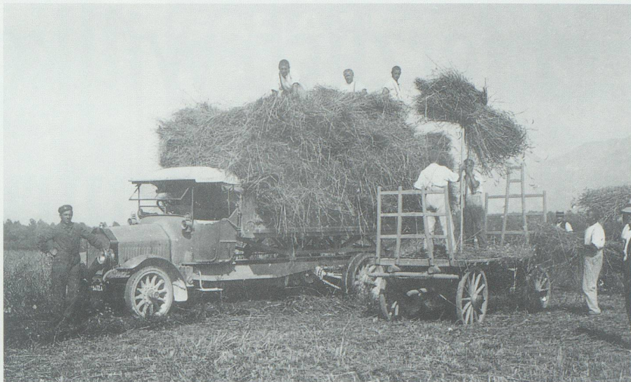
Der kettenbetriebene erste Lastwagen des Strassenkreisesinspektorates Buchs beim Streuetransport im Saxerriet.

Spezielle Weisungen galten für den Dienst in der Garage: Jeden Abend musste der Wagen in vollkommene Fahrbereitschaft gestellt werden. Diese Arbeiten umfassten hauptsächlich das Reinigen vom gröbsten Schmutz, das Ölen und Schmieren des Mechanismus, die Ergänzung aller Betriebsmittel – Benzin, Öl, Fett und Kühlwasser –, die Vornahme einfacher Reparaturen und die Instandstellung der Beleuchtungsanlage. Wöchentlich wurde der Wagen zudem während eines halben Tages ausser Betrieb gesetzt, gründlich gereinigt und revidiert.