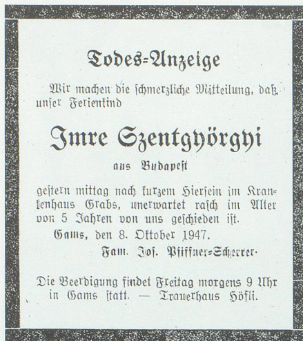
Todesanzeige im «Werdenberger Anzeiger» vom 8. Oktober 1947.