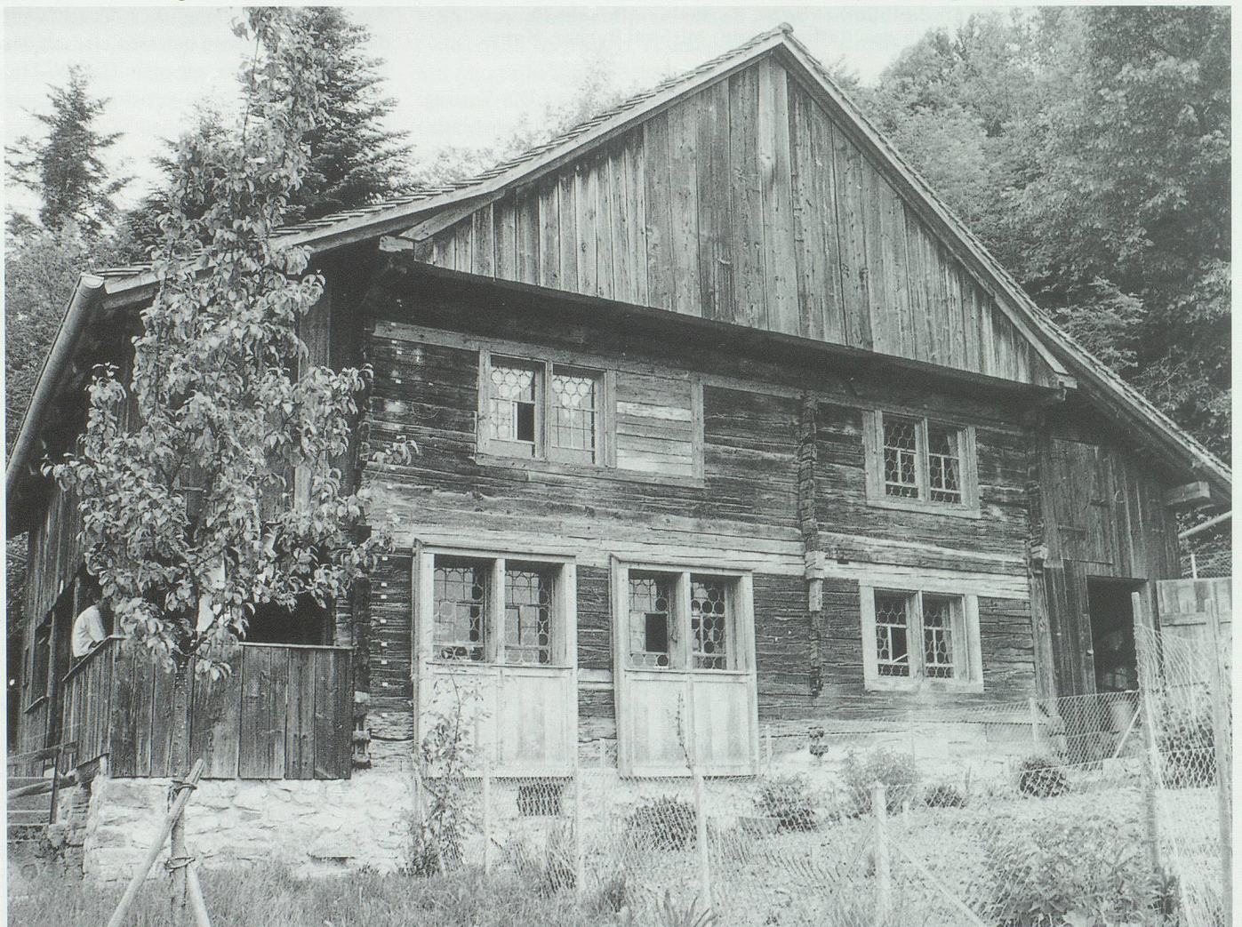
Besuch in Schellenberg: Das sogenannte Biedermannhaus, Zweigstelle des Liechtensteinischen Landesmuseums, ein bedeutender Zeuge der Bau- und Wohnkultur des 16. bis 19. Jahrhunderts.

Ich bedanke mich herzlich bei allen, die sich im abgelaufenen Jahr gemäss unseren Zielsetzungen in direkter Mitarbeit, mit materiellen Zuwendungen oder dem Einbringen von interessanten Ideen und Anträgen engagiert haben.