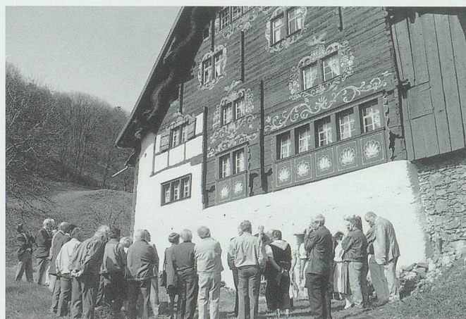
Mit einem feierlichen Akt wurde am 22. April 1996 der Baubeginn begonnen.

Thematisch ergeben sich gegenüber dem schon früher vorgestellten Konzept keine wesentlichen Änderungen. Der neue Akzent liegt vielmehr in der emotionaleren Interpretation und in der gestalterischen Anpassung an diese neue Ausrichtung.