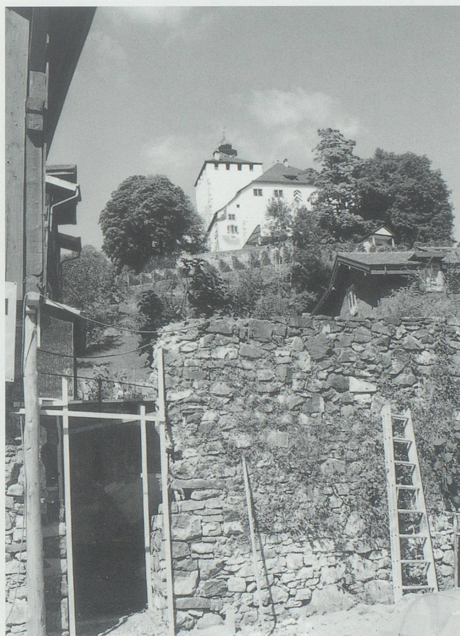
Durchbruch durch die Stadtmauer beim Schlangenhaus.

tung, wurde unter Trommelwirbel eine Urkunde dem Boden anvertraut, welche die Kunde dieses entscheidenden Schrittes über die Zeiten weitertragen soll. An der anschliessenden Medienkonferenz wurde die Gelegenheit wahrgenommen, umfassend und detailliert über den Stand des Projekts, die Finanzierung und das Ausstellungskonzept zu informieren. Zum ersten Mal wurde die Öffentlichkeit in diesem breiten Ausmass über das Werden des Regionalmuseums Schlangenhaus ins Bild gesetzt. Damit sollte auch der Boden vorbereitet werden für die kurz darauf lancierten Sammelaktionen in der Werdenberger Bevölkerung und bei Wirtschafts- und Gewerbeunternehmen. Das erklärte Ziel dabei war die endgültige Schliessung der Finanzierungslücke, die sich noch auf rund 330 000 Franken belief, durch die Solidarität der Werdenberger Bevölkerung. Das Ergebnis