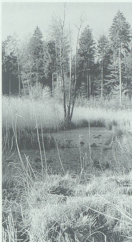
Der See beim «Bad», das heutige Naturschutzgebiet Egelsee.

«Wie du lügst!» stöhnte der Notar. «Wie du lügst! Das alles war viel früher, lange vor dem Kantonsgeometer, lange vor dem Fabrikanten.» Aber er redete leise, ohne aufzublicken. Und Sina hielt keinen Augenblick ein im Erzählen.