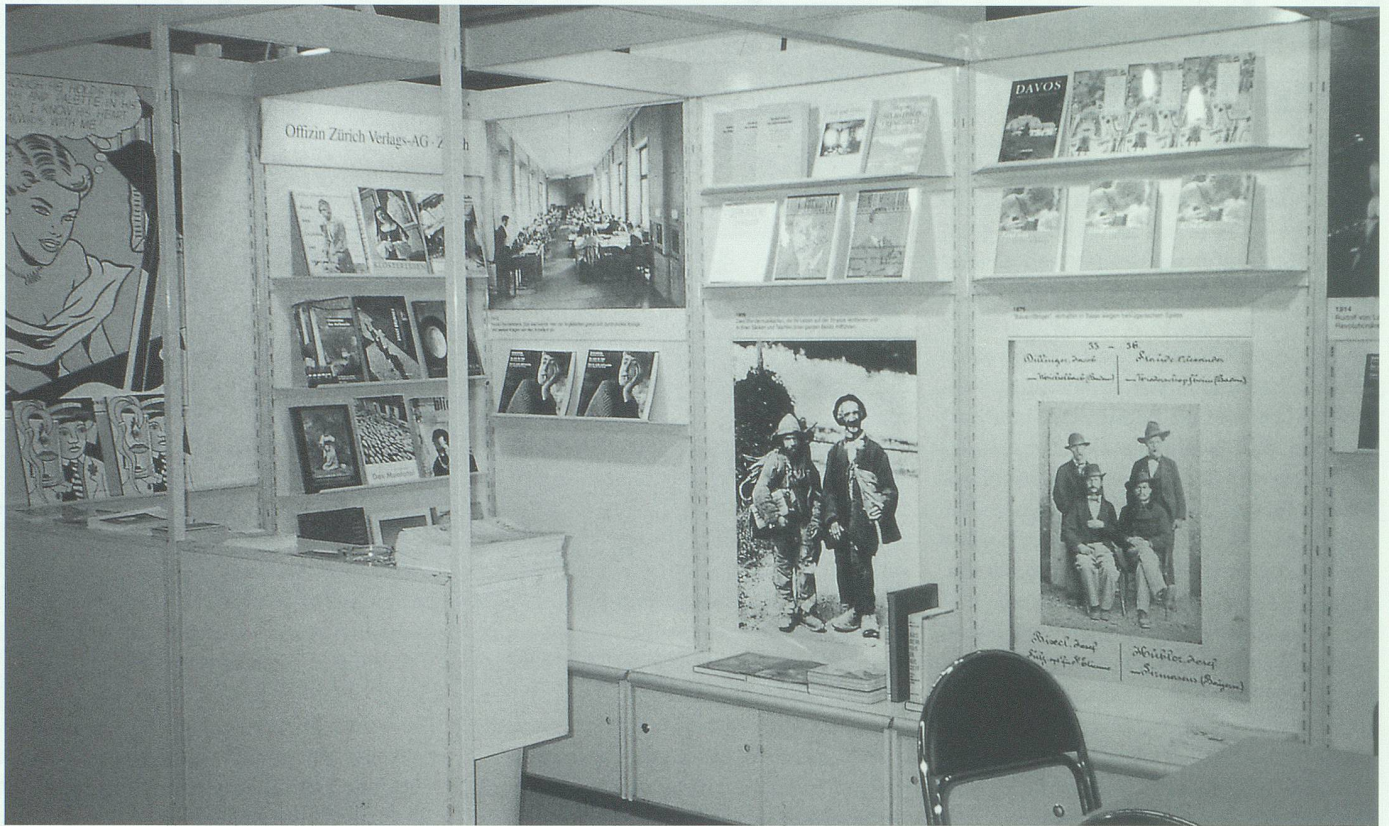
Klein aber fein: Das gilt für Offizin jeweils auch an der Frankfurter Buchmesse.