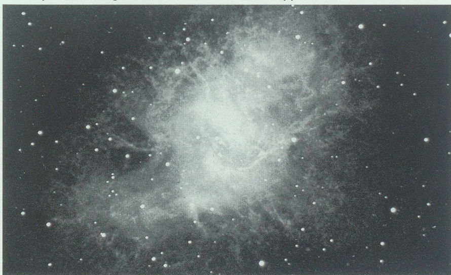
Abb. 2: Der Krebs-Nebel ist der Überrest einer im Jahre 1054 n. Chr. beobachteten Supernova; er befindet sich etwa 5000 Lichtjahre von der Erde entfernt und explodierte folglich etwa 4000 v. Chr. Aus Kippenhahn 1984.

vor dem Urknall, und was liegt ausserhalb des Universums? Ich werde auf diese Fragen eingehen, zuerst möchte ich aber kurz die Entwicklung der kosmischen Strukturen, soweit sie wissenschaftlich unbestritten ist, nachzeichnen.