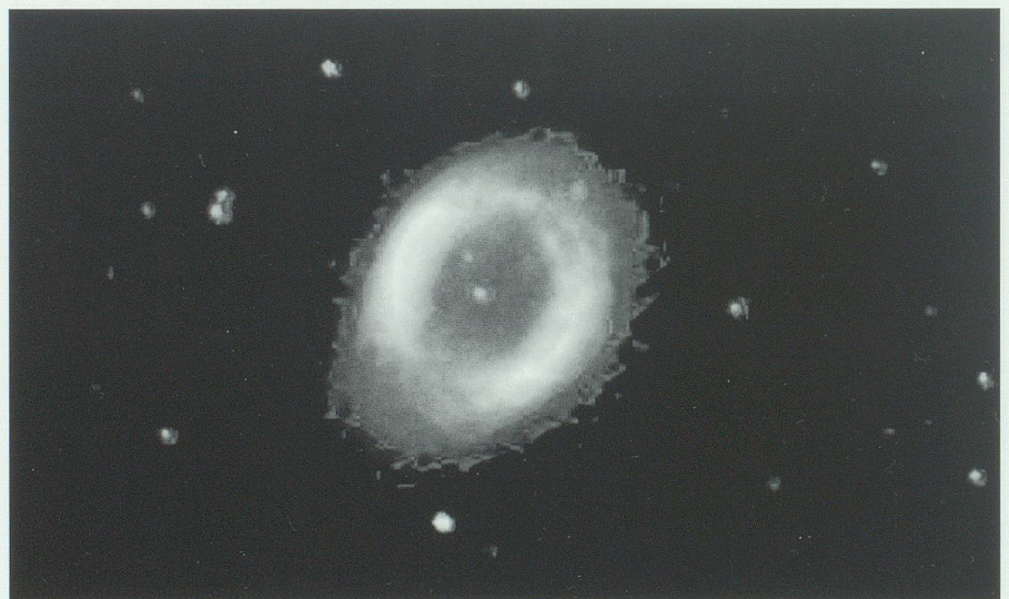
Abb. 4: Tod eines Sterns. Der ringförmige Nebel (M57) ist der Überrest eines sonnenähnlichen Sterns. Aus Collins 1989.

Die grösste mögliche Geschwindigkeit, mit der Materie beim Urknall weggeschleudert worden sein kann, ist die Lichtgeschwindigkeit. Die Ausdehnung des Alls