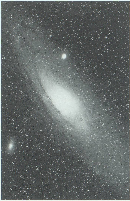
Abb. 3: Der Andromeda-Nebel ist eine Galaxie, welche etwa zwei Millionen Lichtjahre von uns entfernt ist. Was als nebliger Fleck erscheint, sind Millionen von Sternen. Die einzeln erkennbaren Sterne auf dem Bild gehören zu unserer eigenen Milchstrasse. Vom Andromeda-Nebel aus betrachtet, würde unsere Milchstrasse einen ähnlichen Anblick bieten. Aus Kippenhahn 1984.

ben Milliarden Jahren, das heisst vor fünf Milliarden Jahren, unser Sonnensystem entstand (Abb. 3).