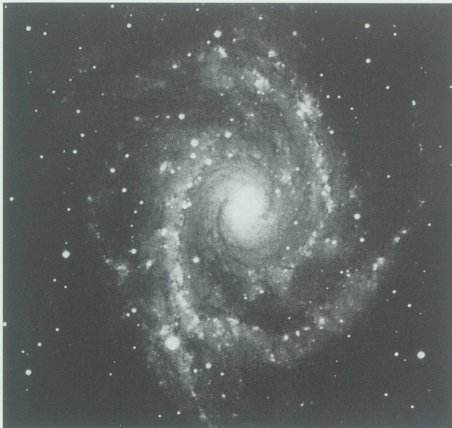
Abb 1.: Galaxie NGC 2997. Diese Milchstrasse erinnert mit ihren Spiralarmen an ein Feuerrad.

Jahrzehnten ist die Theorie vom expandierenden Universum mit Beobachtungen und Berechnungen derart solide untermauert worden, dass sich heute kaum noch Astronomen finden, die sie grundsätzlich in Frage stellen.