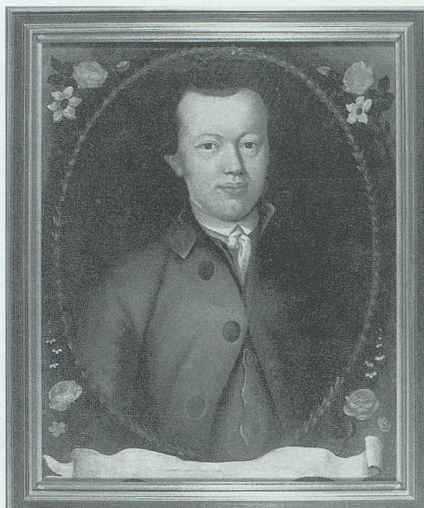
Marx Vetsch (1759–1813). Ölgemälde, in Privatbesitz.

Bereits 1792 hatte Marx Vetsch im Rahmen der Gründung einer Büchergesellschaft eine Neujahrsansprache verfasst und sogar drucken lassen. 1 Darin singt er das Lied der Aufklärung und preist die Pressefreiheit unter Kaiser Joseph II. und das dadurch möglich gewordene Schrifttum, um sich dann dem kleinen Ländchen Werdenberg zuzuwenden, dessen Armut er als selbstverschuldetes Elend brandmarkt. Es folgt eine bisige, ja satirische Kritik an den Zeitgenossen – davon nimmt er nur die «edlere Klasse der Menschen, die Stillen, die Rechtschaffenen, die Wissbegierigen, die Patrioten, die Volksfreunde» aus – und entlarvt vor allem die Unwissenheit, besonders den Mangel an wirtschaftlichen und politischen Kenntnissen. Schliesslich findet er den Grund für die innere Mutlosigkeit und äussere Kraftlosigkeit im Fehlen von Schulen, «die über den todten Buchstaben hinaus sind, geschweige denn solche, worin der anwachsenden Jugend durch Vorlesungen über Naturlehre, Geographie, Geometrie, Historie und Spra-