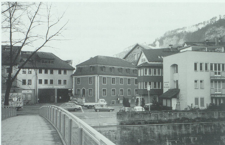
Blick über den Stellasteg auf den Feldkircher Mühletor- oder Saumarktplatz, in der Bildmitte das im Biedermeier errichtete Stammhaus der Grassmayr-Fabrik.

Gleich im Jahr 1791 erreichte Jakob Grassmayr auch vom Stadtmagistrat die Zustimmung, eine «Giesstatt in seinem Hause» errichten zu dürfen. Diese Glockengiesselei im Hinterhof des Hauses Marktgasse 1 in Feldkirch bestand bis zum Ersten Weltkrieg. Wenn in neueren Publikationen davon die Rede ist, die Feldkircher Glockengiesselei sei im Grassmayr-Gebäude am Mühletorplatz betrieben worden 3 , so liegt