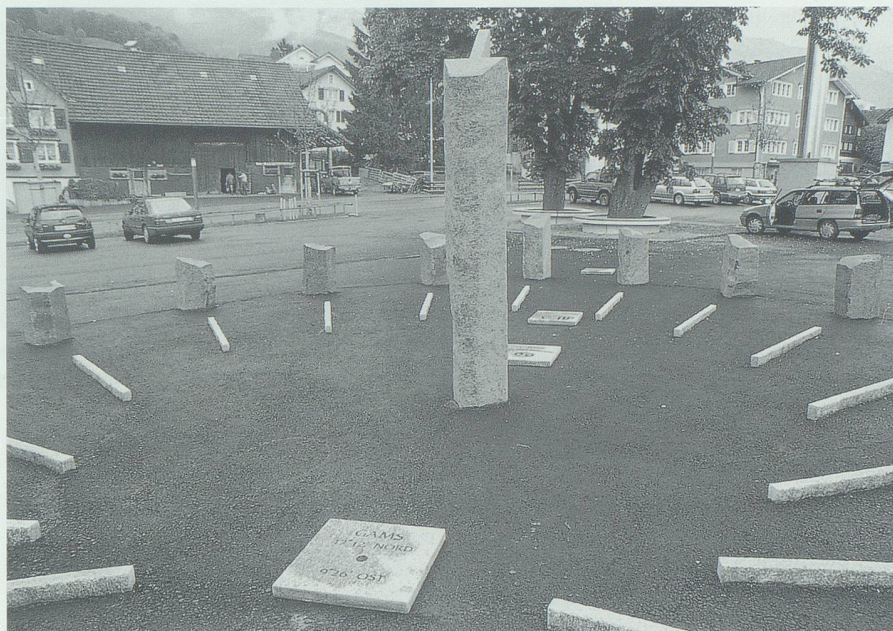
Dank dem Entgegenkommen der Ortsgemeinde Gams konnte am Rande der Schulanlage Hof ein geeigneter Standort für die Sonnenuhr gefunden werden.

Heute ist es selbstverständlich, das die präzisen Uhren über Funk von Frankfurt aus weltweit synchronisiert werden – man denke nur an die Folgen kleinster Abweichungen im internationalen Flugverkehr!