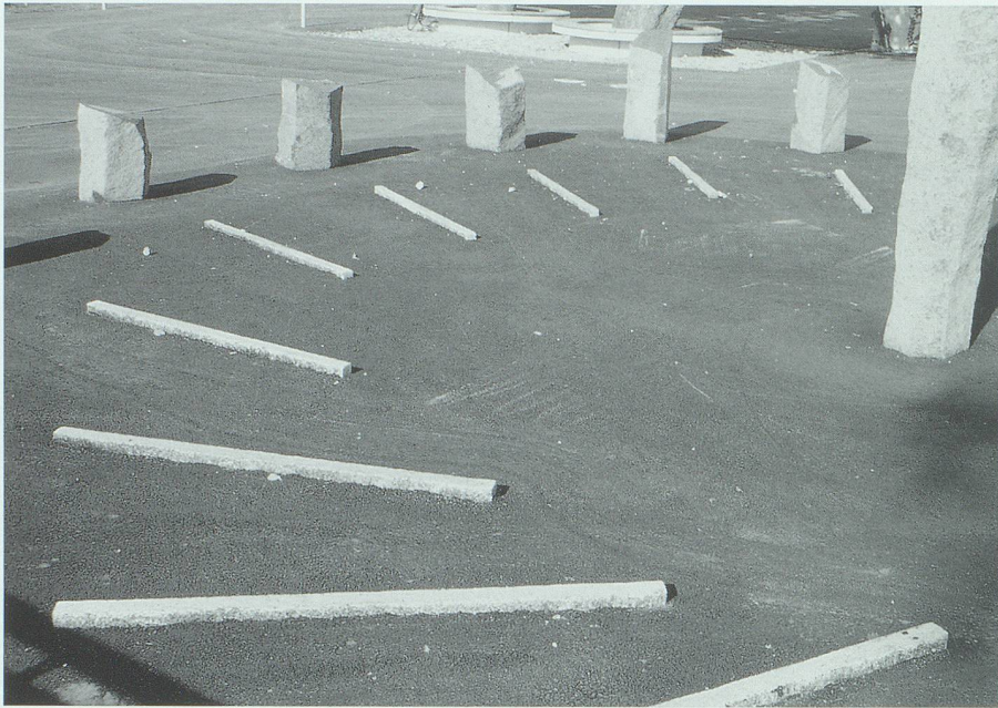
Die Granitstreifen stellen die Stundenlinien dar; sie haben den sogenannten Fusspunkt des Zeigers zum Zentrum.

nannten Frühlingspunkt 7 geht, sich auf dem Himmelsäquator bewegt und während des Jahres in einer angenommenen konstanten Bahngeschwindigkeit läuft. Diese fiktive mittlere Sonnenzeit ermöglicht es, eine einheitliche Tages- und damit auch Stundenlänge zu erhalten. Ihre Abweichung von der wahren Sonnenzeit schwankt zwischen +16,2 Minuten am 4. November und -14,4 Minuten am 2. Februar. Wenn die