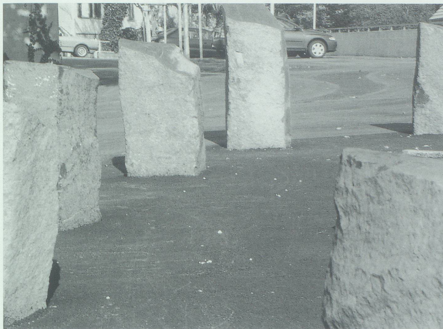
Die verschieden gross gestalteten Kreissteine erinnern an die prähistorischen Zeitkreise.

maturgie des Objektes eine grosse Rolle. Die verwendeten Basaltsäulen sind allein schon in ihrer Form sehr bestimmend, ja geradezu rigide. In der subtilen Gestaltung des äusserst harten Materials sind die Kraftlinien herausgeholt worden. Diese Kraftlinien öffnen den Körperumriss und schliessen uns in die Thematik ein.» Zusammen mit seinem Freund, dem Österreicher Steinbildhauer Kurt Seehofer, hat er die künstlerische Idee umgesetzt.