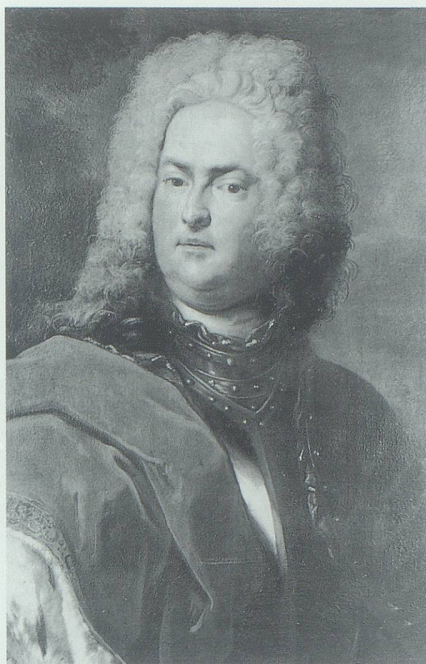
Fürst Johann Adam Andreas von Liechtenstein (1657–1712).

Die 250-Jahr-Feier wurde damit – im Unterschied zur 200-Jahr-Feier – ein Fest des ganzen Staates, nicht nur des Unterlandes. Nach dem Festgottesdienst hielt auch der Landesfürst eine Ansprache: Fürst Franz Josef II. dankte einleitend dem liechtensteinischen Volk für die vorbildliche Haltung, die es in den letzten 250 Jahren im-