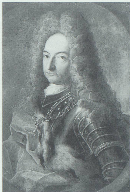
Fürst Anton Florian von Liechtenstein (1656–1721).

Richtig schlimm wurden die Klagen aber erst unter seinem Sohn Ferdinand Karl. Von ihm schreibt Peter Kaiser: «Zur Verschwendung, zu Willkür und Gewalttätig-