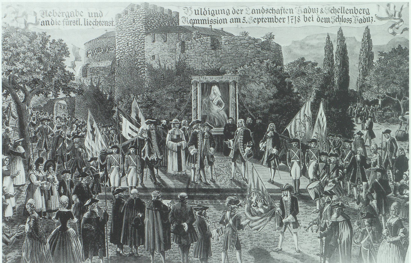
Die Huldigungsfeier von 1718 in einer Darstellung von Eugen Verling.

Liechtenstein werden hingegen mit keinem Wort erwähnt.