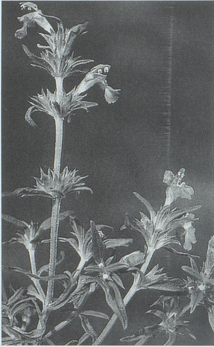
Das Östliche Zackenschötchen ( Bunias orientalis L.), ursprünglich aus Westasien, ist via Osteuropa bei uns heimisch geworden. Bild aus «Flora Helvetica», Bern 1996.

nischen für seltene Pflanzen auf dem Bahnareal von Buchs müssen – inmitten von Industrie-, Landwirtschafts- und dicht besiedeltem Wohngebiet – als Inseln erhalten und geschützt werden. Wie aber kann man diese Forderungen der Einsicht der Verantwortlichen und der Allgemeinheit verständlich machen, nachdem der Zugang in diese Gebiete ausschliesslich dem Betriebspersonal vorbehalten ist? Da stehen weder die oft unauffälligen, meist niederwüchsigen, in zerstreuten Nischen vereinzelt auftretenden Adventivpflanzen als sichtbares Kriterium für deren Bedeutung im Naturganzem, noch können sie als Erlebniswert herangezogen werden. Damit ist zum vorneherein jegliches Nützlichkeitsdenken ausgeschlossen. Was hier als dringendes Gebot der Zeit bleibt, ist das Selbstverständnis zur Natur, die Bereitschaft, sich von ihr in die Pflicht nehmen zu lassen, sie zu schützen, wo immer die Möglichkeit dazu besteht.