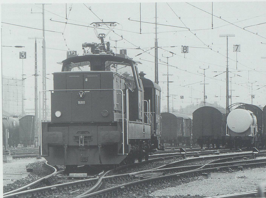
Rangierbahnhof Buchs: Durchgangsstation auch für mancherlei Pflanzen.

Ganz besonders artenreich und interessant war in Buchs bis in die siebziger Jahre das Areal bei der Viehrampe im Freiverlad, wo Import- und Transitvieh aus- oder umgeladen wurde. Dabei gelangte aus Heu, Stroh und Futtermaterial viel fremdes Saatgut zwischen die Gleise und neben die Schienen, wo günstiger Nährboden bereitlag. Die Bestimmung der keimenden und spä-