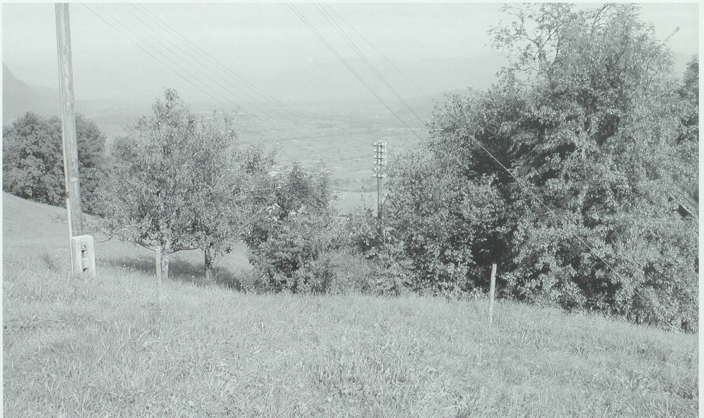
Blick vom Hofbrunnen talwärts gegen das sogenannte Grässlisloch, wo die Wäschestelle war.

Der Richter hat diesem nun die Benützung der von der Gegenpartei beschwerdeten Abwasserbezugseinrichtung untersagt und Tinner glaubt nun dem Spruche damit gerecht worden zu sein, indem er das Rohr, das die Wasserzuleitung aus dem Brunnenbette vermittelte, entfernte, im übrigen aber die Leitung bestehen liess. Er behilft sich nun damit, dass er von Zeit zu Zeit, je nach Bedarf, die Leitung durch