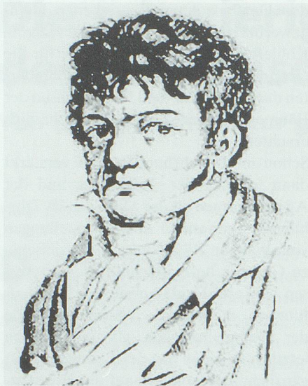
Heinrich Zschokke (1771–1848): Schriftsteller, Politiker und einer der bedeutenden Pioniere des neuzeitlichen Forstwesens.

wesens, des Schriftstellers und Politikers Heinrich Zschokke 6 , entnehmen: «Während die Hand des Fleißes jede Spanne urbaren Boden aufs höchste benutzte, selbst den Felsen mit Erde bedeckte, ihm Früchte abzugewinnen, lag in den Gebirgsgegenden des südlichen Deutschlands und der Schweiz der sechste, oft der vierte, zuweilen der noch größere Theil des Landes mit Gesträuchen fast mehr, als Wäldern bedeckt, ein ansehnliches und todtes Kapital da.» 7 Zschokke rügt damit also, dass man abgeholzte Flächen einfach sich selber überliess und für den Neuaufwuchs kaum etwas tat. Er geht denn auch ausführlich ein auf den «Wiederanbau der in schon vorhandenen Wäldern entstandenen Räumden und Blößen» und auf die «Wiederbeholzung kahlgeholzter Waldstriche, worauf von sich selbst kein gutes Holz mehr wachsen will». Und ganz im Geist ökonomisch-kommerzieller Überlegungen empfiehlt er, beim Anlegen solcher Waldungen «wird zuerst es darauf ankommen, daß man bestimme: Welche Holzart ist in der Gegend am nöthigsten? folglich am gesuchtesten und am besten bezahlt?» 8