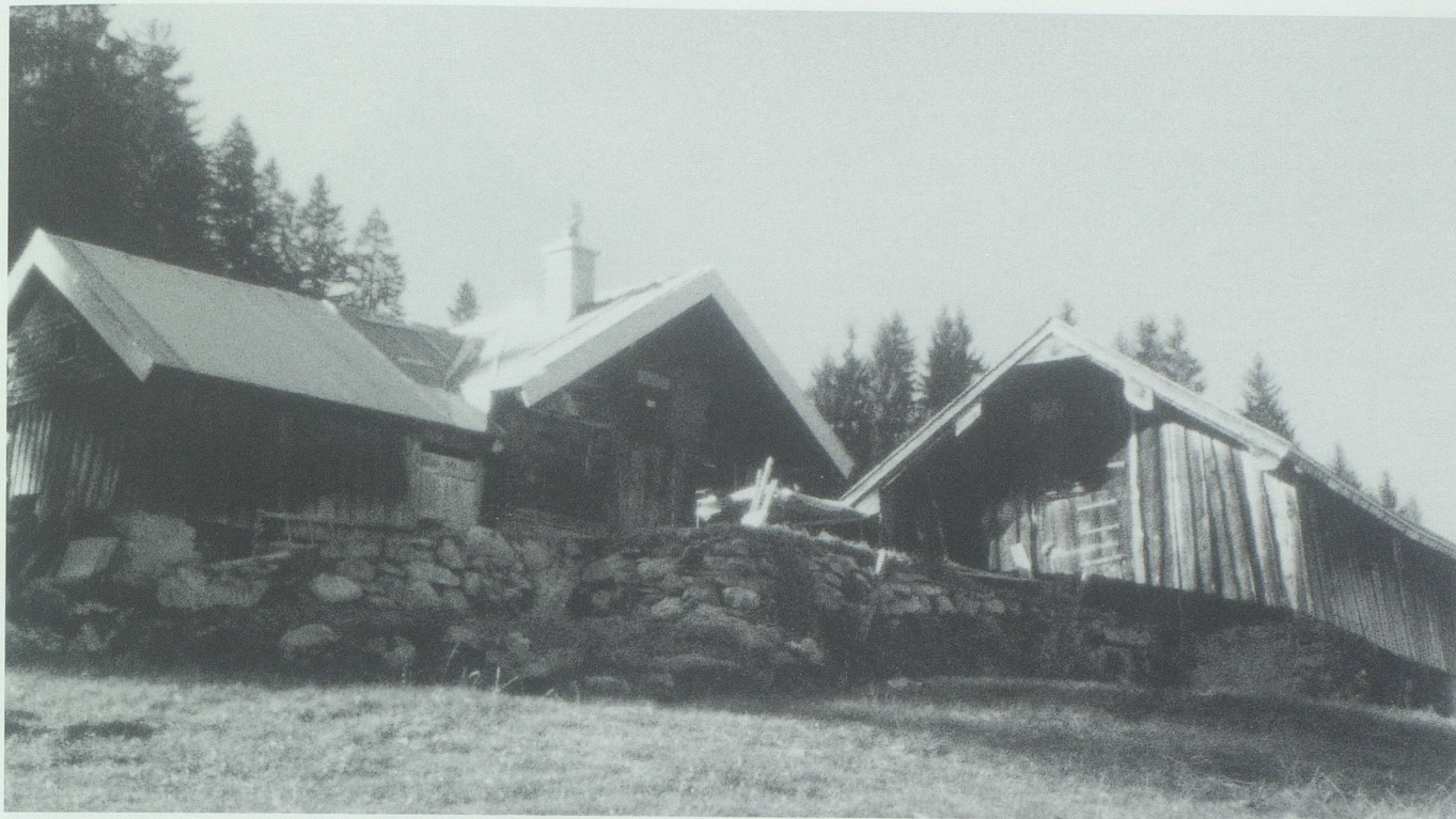
Die Algebäude auf der Gupfe vor dem Neubau des Viehschopfs in den neunziger Jahren.

zuzuhören und gefälligst auch über nicht Lustiges mitzulachen. Da wurde geprahlt mit Vieh, Ross und dem vielen in kurzer Zeit geführten Holz, da wurde über Gott und die Welt geredet, Dorf- und Bergklatsch ausgetauscht, über die Förster