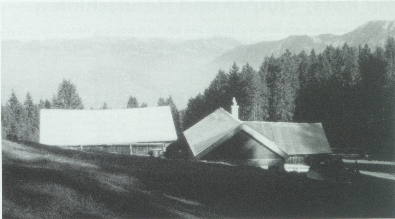
Das Älpchen Gupfe, im Hintergrund rechts die Dreischwesternkette, links das Rheintal, der Eschnerberg und die Vorarlberger Berge.

nur vorgeführt. Von der Gupfe weg gings dann nämlich rasant bergab.