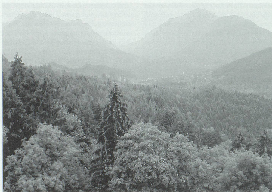
Fichten- und Weisstannenwald mit eingestreuten Föhrenbeständen oberhalb Rankweil: Blick von Batschuns über Göfis zum Saminatal.