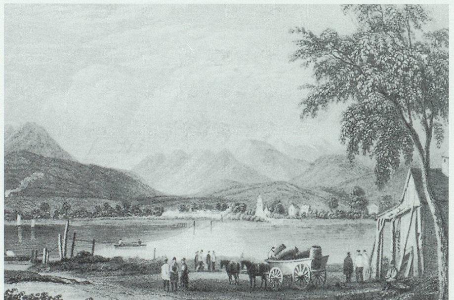
Die Oberrieter Fähr Blatten-Meiningen mit dem abgestützten Fährseil wurde oft für Rohrers Holztransporte benützt. Aus Gabathuler 1992.

Nachdem der Bedarf an Bauholz für Glarus einigermaßen befriedigt war, trat mehr und mehr der Handel mit Eichen in