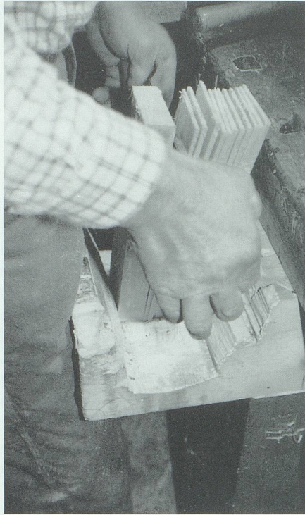
Aus jeder Mösele werden 20 bis 30 Schindeln geschnitten.

Natürlich werden die meisten heute verwendeten Holzschindeln industriell hergestellt. Handgemachte Schindeln sind naturgemäss teurer, halten dafür aber auch bedeutend länger als die maschinell hergestellten. Die aufwändige Verarbeitung und die damit verbundenen Kosten für Schindelfassaden sowie die Konkurrenz durch günstigere und ebenfalls haltbare Materialien haben zum allmählichen Verschwinden des Schindelmacher-Handwerks geführt. Vielleicht aber führt die bereits erwähnte Wiederentdeckung natürlicher Baustoffe dazu, dass der fast ausgestorbene Beruf des Schindelmachers eine Art Wiedergeburt erlebt. Die derzeitige Nachfrage scheint dies zu bestätigen: Allein Hansueli Wenk verarbeitet jeden Winter etwa neun Kubikmeter Holz zu rund 80 000 Schindeln, und er könnte, wie er sagt, ein Mehrfaches davon verkaufen.