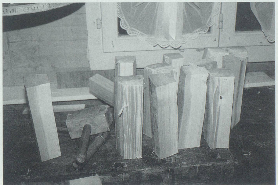
Die Möseln für die Schindelherstellung sind bereit gemacht.

Schindeln sind ein hochwertiger biologischer Baustoff. Aufgrund des natürlichen Harzgehaltes im Holz sind sie wasserabweisend und haben eine hervorragende Haltbarkeit und Isolationsfähigkeit. Handgemachte Schindeln halten ohne weiteres siebzig Jahre, solche aus Lärchenholz sogar noch weit länger. Auf Fassaden werden Schindeln so angebracht, dass nur rund ein Drittel der ganzen Schindellänge sichtbar ist, die restlichen zwei Drittel werden durch die nächste Schindellage abgedeckt, was zur überaus hohen Isolationswirkung führt.