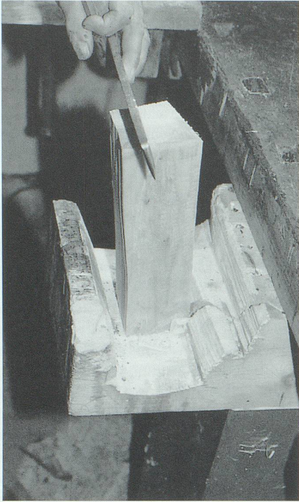
Beim Beizen wird die Mösele je nach gewünschter Schindeldicke angeschlagen.