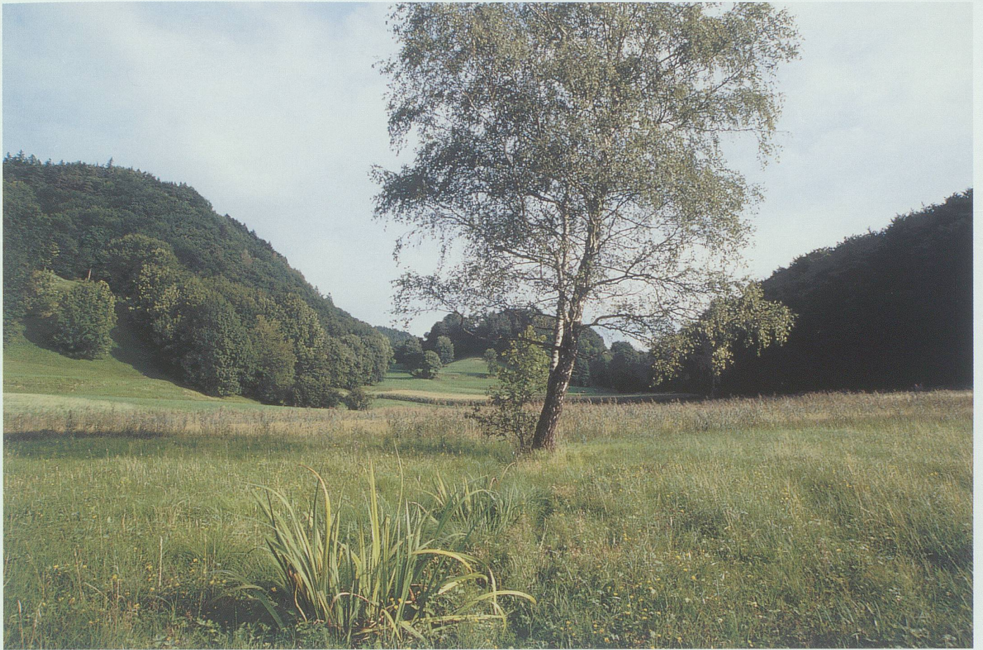
Am einstigen Schaner See – Blick gegen Matinis und Plana – trat der «Gröahüetler» als strenger Strafer eines Marchenbrenners auf.

überlassen, der schweigen könne. – Die Goldvögelchen, die Dublonen und Taler sind schon lange in alle Winde verfliegen, nur das Kesselchen blieb noch übrig. Wenn es dich wundert, sage ich dir, wo es ist! 51