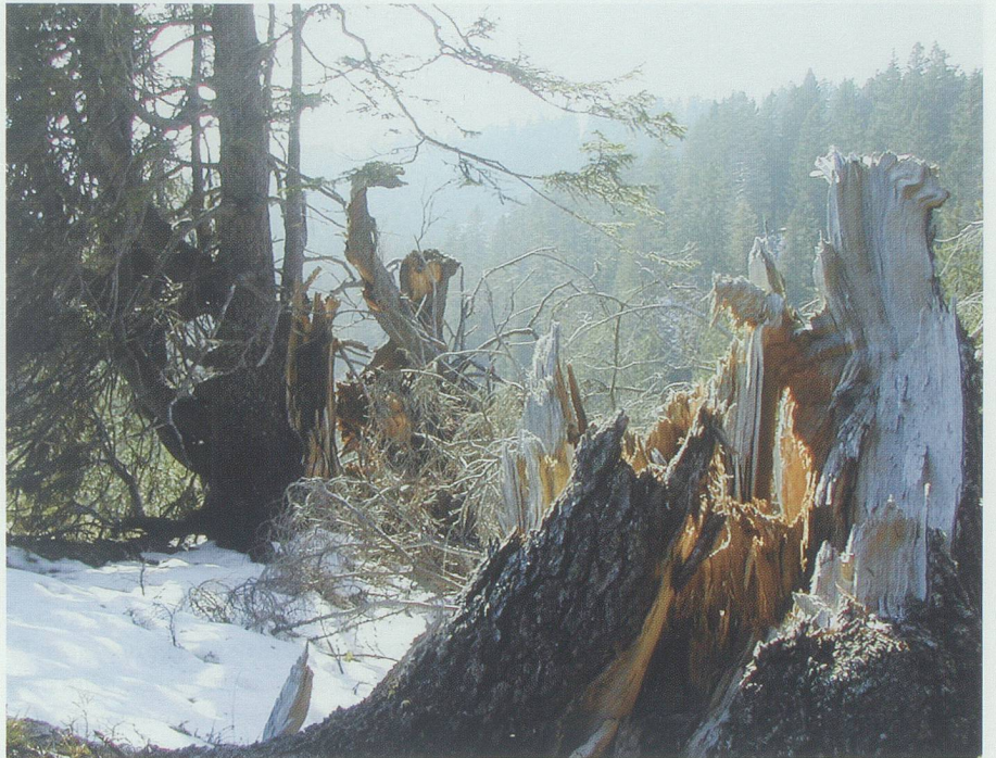
Für unsere Vorfahren war der Wald mit vielen geheimnisvollen Wesen bevölkert: mit Kobolden und Elfen, mit dem «Gräggi», dem «Wüetihö» und anderen Sagenwesen.

Die Hexen, die für unsere Ahnen eine eigene Sippschaft des Bösen darstellten, hatten sich bekanntlich mit Haut und Haaren, mit Leib und Seele dem Teufel verschrieben. Ihr Zauberstab war die Wünschelrute aus Haselholz, die ihnen die Macht verlieh, sich zu jeder Zeit in al-