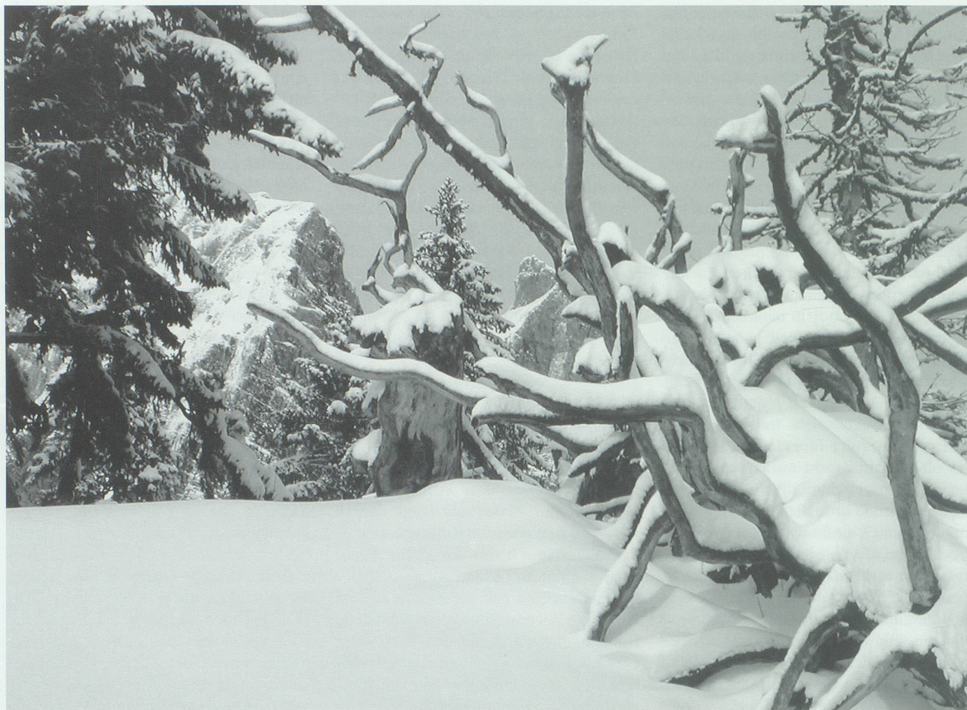
Die unheimliche Begegnung zwischen dem Chamm-Joas und einer Hexe in Gestalt eines Eichhörnchens trug sich im Gebiet Elabria-Paschga zu.

durch die Tobel und zündet den Marchenrückern, den gefallenen Frauen 24 beim Waschen ihrer Kindbettwäsche und den Sauen beim mitternächtlichen Tanz. 25