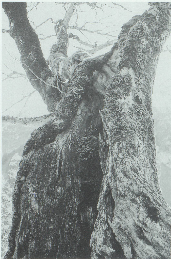
Die höchsten Bäume am Grabserberg lieferten den Grund für die mörderischen Schandtaten eines Verwirrten.

aber den Faulen Knöpfe in die Fäden und verwickle ihnen die Wollknäuel, damit sie etwas zum Verweilen hätten. Wenn einer, der sie höre, die Neugierde plage, dass er alles wissen wolle, den führe sie am Narrenseil herum, dass gar der Mond nicht mehr zuschauen könne vor lauter Kichern und Lachen, bis der heimliche Lauscher für sein wundernasiges Tun in ein Lehmloch oder in eine Jauchepfütze gefallen sei.