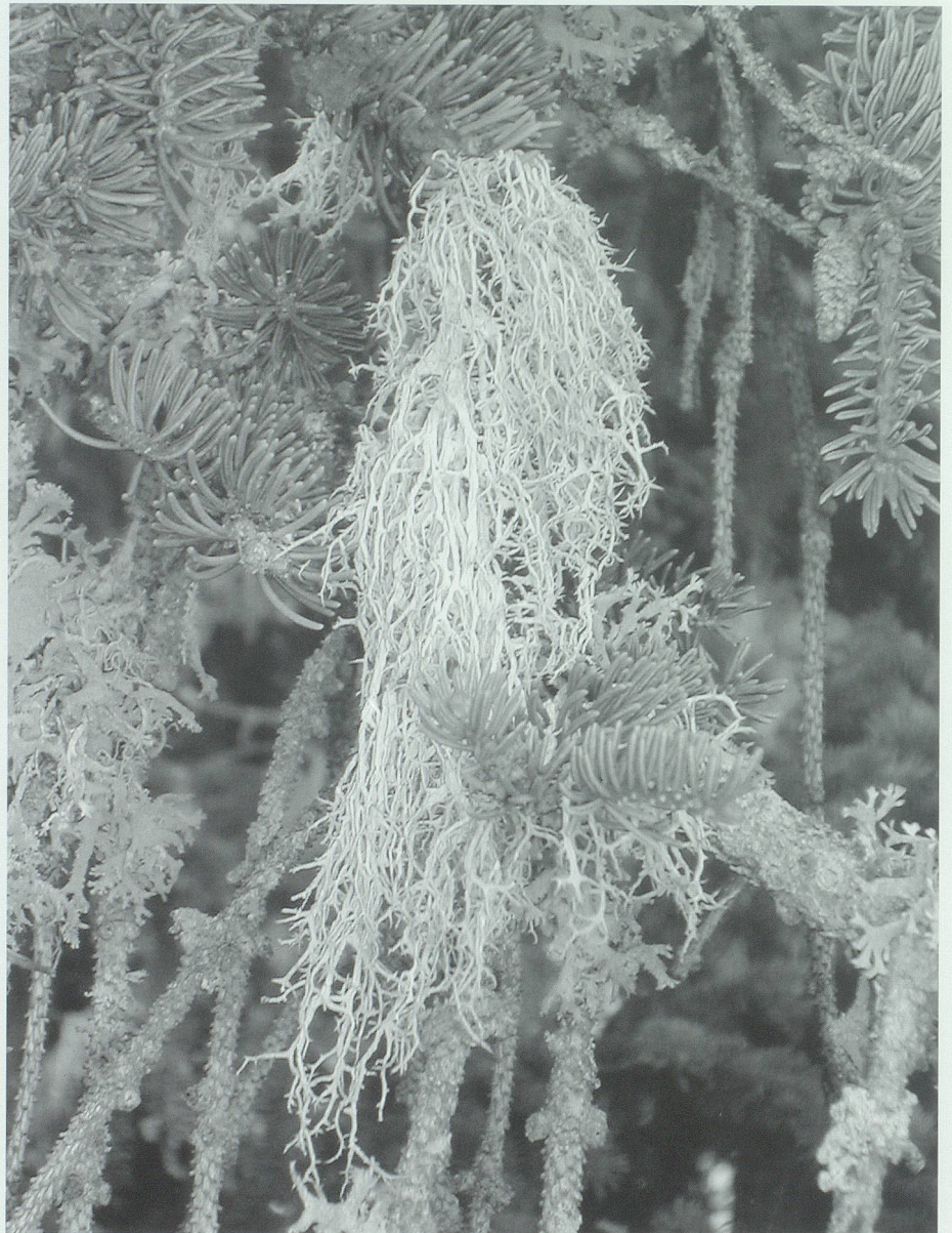
Die grauweissen Bartflechten ( Usnea barbata ) – das Haar der Feanggen – finden sich bevorzugt an Fichten und Tannen im feuchten Bergwald.

Beim Bau des Rathauses auf Palfris hatte der Junge des Chammjoas den Firstbalken allein aus dem Wald auf den Bauplatz geschleift, und auch die gewaltige Trittplatte davor brachten die beiden Chammjoasen her und setzten sie allein an die richtige Stelle. Sämtliches Eisen zum Bau des Rathauses brachte der Junge von der Schmiede in Azmoos in einem Trag auf den Berg. Als er auf Elabria seine Last auf dem Schermdach abstellen wollte, um sich etwas auszuruhen, krachte es im Gebälk. Trocken meinte der Hüene: «Wenn