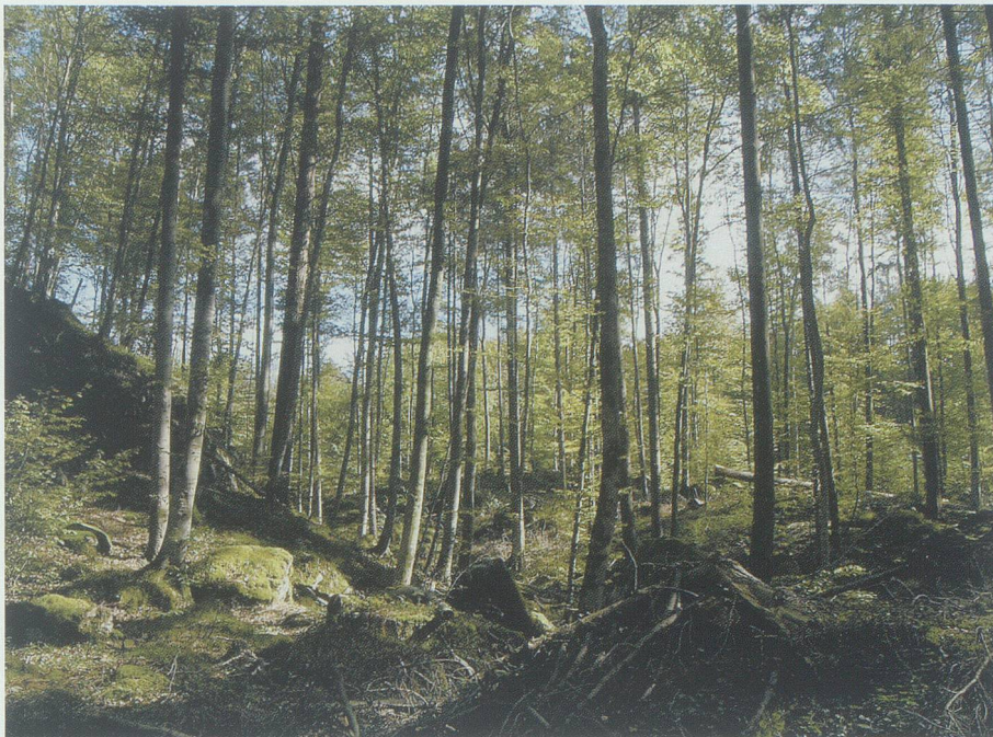
Auch im Salezer Schlosswald sollen sich einst Venediger als Goldsucher aufgehalten haben, die manche Kunst kannten, die andern verborgen blieb.

Jetzt warf er das Eichhörnchen in des Teufels Namen vor sich in den Schnee, stand ihm mit dem Schuhabsatz auf das Köpfchen und zerdrückte es: «Da hast du den Lohn, du unverschämtes Aas!» Er musste sich setzen und schnaufte eine ganze Weile tief.