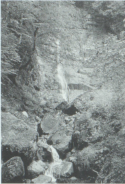
Der nächtliche Reiter am Geissbachfall im Buchserbach-Tobel sühnt als Spukgestalt den ungestraften Mord an seinem Köhler-Kumpel. Bild: Hans Jakob Reich, Salez.

In Grabs wird erzählt, dass einmal ein Soldat aus Werdenberg, der Handgeld für fremde Kriegsdienste genommen hatte, mit einer Hexe auf einem Besenstiel aus Haselholz nach Grabs geflogen sei, sich am andern Morgen aber wieder auf seinem Posten in Holland befunden habe.