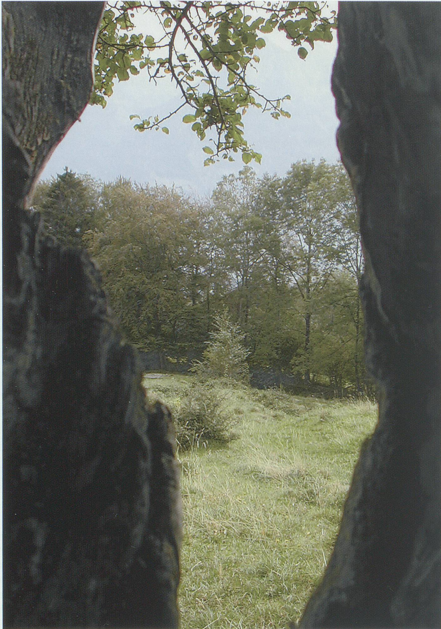
Durchsicht durch einen hohlen Holzapfelbaum in der Steighalde (Wartau): War hier der Baumplütscher am Werk?

das andere mache er schon selber. In einem Jahr sei es dann bereit, dann richte er dem Drachen das Gitzl in den Rachen, das wolle er probieren. – Der Rat gefiel allen.