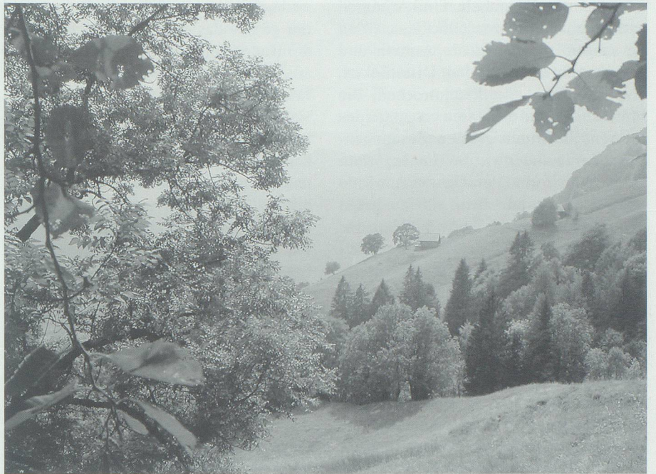
Der hilfsbereite Kobold am Walserberg, der durch den nicht geforderten Lohn – ein Paar neue Schuhe – vertrieben wurde, hauste auf Gresta.

Auf herzlose Weise beseitigte er diesen Übelstand für immer: Er schlug einen Grotzen 31 , löste die Rinde weg und legte sie, die innere Seite aufwärts, aufs Falwegli. Als dann das Kühlein wieder den verbotenen Weg ging und auf die schlüpf-