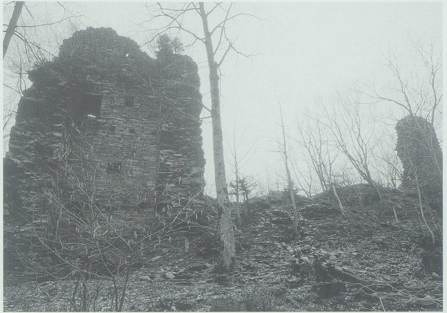
Aus dem Tännchen auf der Ruine Hohensax soll dereinst eine Wiege gezimmert werden. Das Kind, das darin liegen wird, kann – zum Mann herangereift – vielleicht die arme Seele des Burgfräuleins erlösen.

Jetzt erhob sich der Riese von seinem Eichenstrunk und winkte mit seinem Haselstecken. Die Geiger im Dornengestrüpp schwiegen, und die Tanzenden hielten still. Wieder ein Wink mit der Haselrute, und alle fielen auf die Knie. Der Riese nahm seinen Hut ab. Sieh an – zwei Bockshörnchen zeigten sich zwischen den Haarlocken! Dann setzte er sich wieder auf den Baumstrunk. Ein Kuhschwanz kam unter dem Mantel zum Vorschein, den er über das linke Knie legte. Anstatt der üblichen Stiefel trug der Gehörnte Pferdeschuhe! Ein dritter Wink mit dem