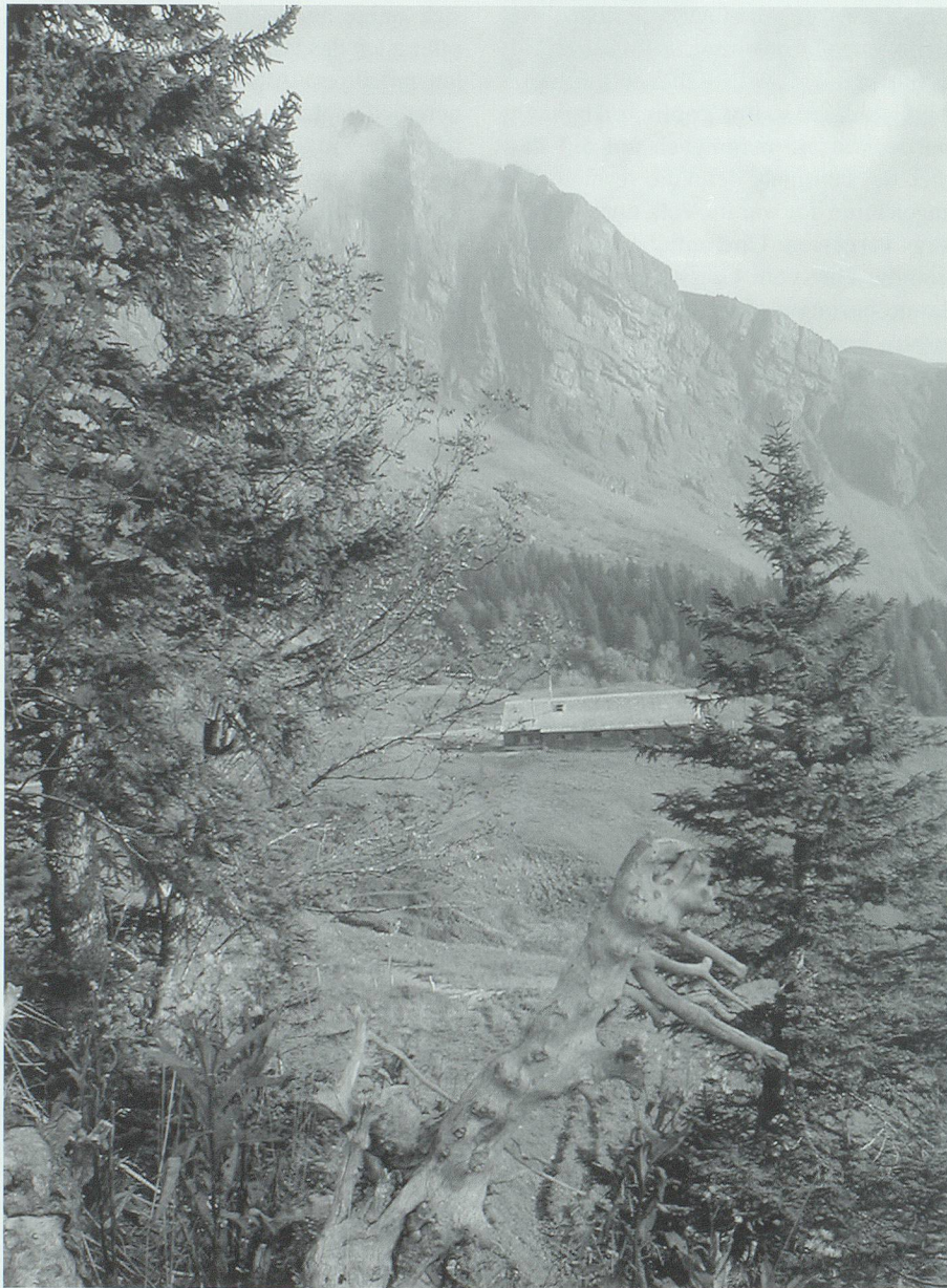
Das Dach des Scherms auf Elabria drohte einzustürzen, als der junge Chamm-Joas seinen Trag Eisen darauf abstellen wollte.

Im Vordergrund der Begegnungen mit dem Grääggi stehen wohl die zahlreichen Irreführungen. Die mit ihm gemachten Erfahrungen lehren die Zuhörenden, die Neugier im Zaum zu halten und sich nicht mit ihm einzulassen. Wer dies missachtet, den verführt das Grääggi und schadet ihm. 20