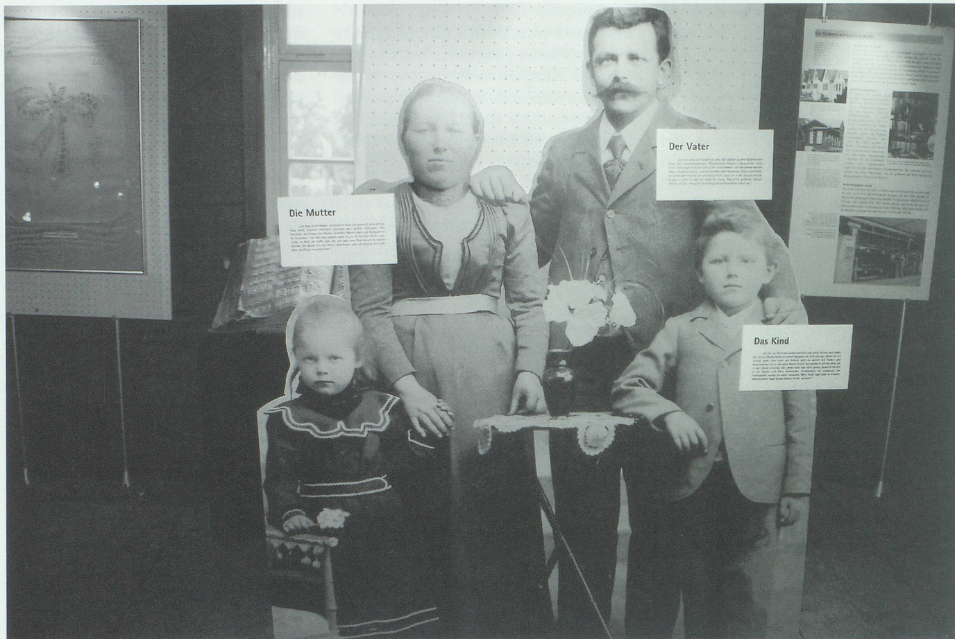
Eine Werdenberger Stickerfamilie begrüsst die Besucherinnen und Besucher des Regionalmuseums Schlangenhaus.

vetik sowie im jungen Kanton St.Gallen dargestellt.