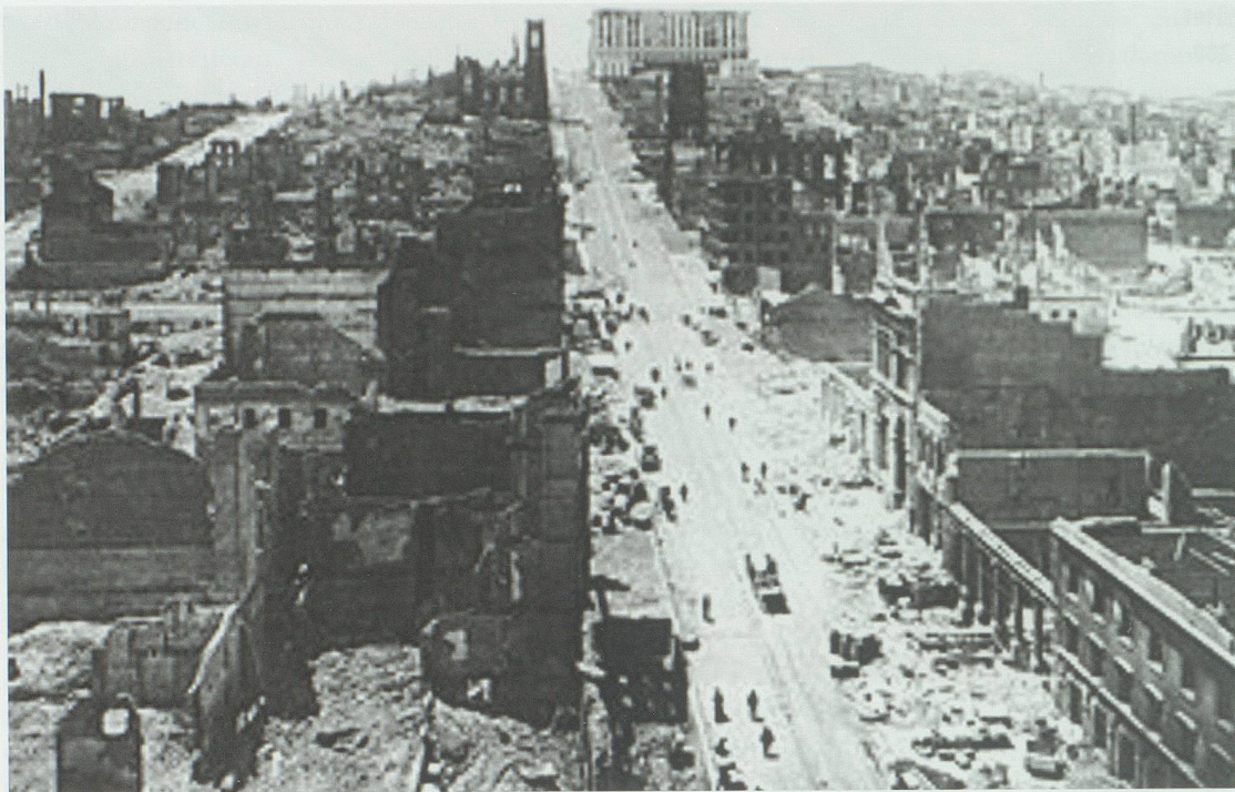
Brand nach dem Erdbeben von San Francisco, 1906. Das Feuer erfasste eine Fläche von 1100 Hektaren, wütete drei Tage lang und zerstörte weit mehr als das Erdbeben selbst: 500 Menschen waren sofort gestorben, die Brände töteten weitere 2500.