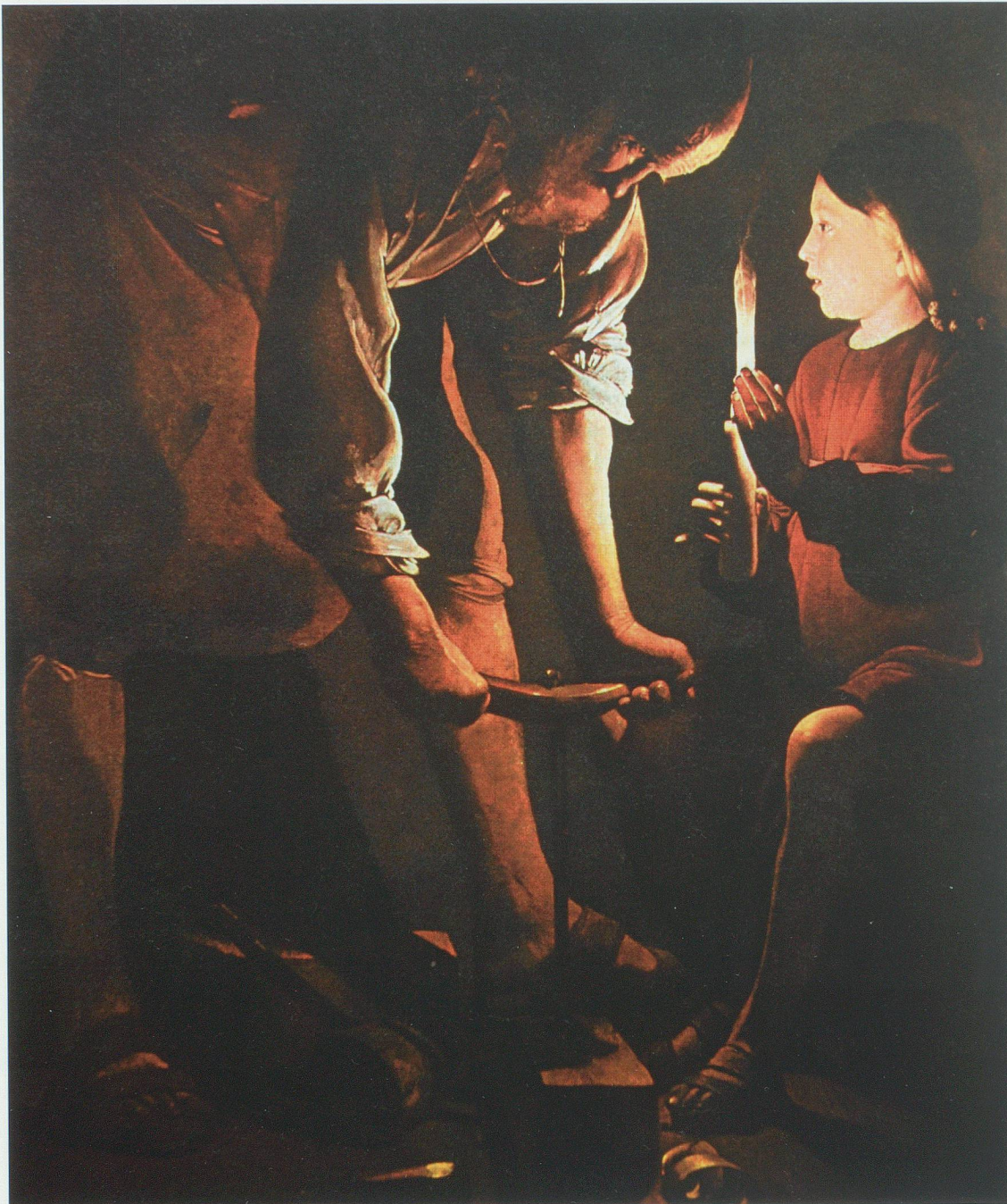
Das Feuer leuchtet und wärmt. Gemälde von Georges de La Tour (1593–1652), «Der heilige Josef als Zimmermann». Im Louvre, Paris

ist Feuer ein wiederkehrendes und gleichzeitig ambivalentes Thema. In der indischen Mythologie wird das Feuer von Agnis, dem Gott des Feuers und allen Anfangs, in die Welt gebracht. In der griechischen Sagenwelt ist es Prometheus, der den Raub des Feuers für die Menschen bitter büßen musste. Ein biblisches Motiv ist Moses und der brennende Dornbusch. Für die Kehr-