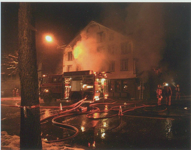
Die Feuerwehr – hier am 28. Februar 2006 in Buchs – ist Tag und Nacht einsatzbereit.

Das grösste Problem in der heutigen Feuerwehr ist die hohe Belastung der Mannschaft. Viele Einsätze, Wochenendpikett und hohe Ansprüche schrecken den einen oder anderen ab, Feuerwehrdienst zu leisten. Vieles läuft heute aber über die Feuerwehr, und zusammen mit den Samaritern ist diese Organisation die einzige, die Tag und Nacht für alle möglichen Einsätze bereitsteht. Bei Notfällen werden die Familie und die Arbeit zurückgelassen, und von einer Minute auf die andere wird aus dem Büroangestellten, Landwirt oder Mechaniker ein Feuerwehrmann. Nicht zu vergessen sind die Frauen, die heute vermehrt im Dienste der