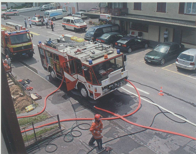
Ein Fahrzeugpark mit Tanklöschfahrzeug, Rüstwagen und Mannschaftstransportwagen gehört heute zur Grundausstattung jeder Werdenberger Gemeindefeuerwehr.

so einfach, doch immer wieder entdecken junge Leute, was das gemeinsame Leisten eines Einsatzes für die Allgemeinheit an Genugtuung bringt. Jeder, der einmal in der Feuerwehr gedient hat, lernt Verantwortung tragen und Krisensituationen meistern. Feuerwehrdienst zu leisten, zählt also mitunter zu den schönsten Freizeitbeschäftigungen, und man kann jedem, der physisch dazu in der Lage ist, nur empfehlen, sich dieser Herausforderung zu stellen.