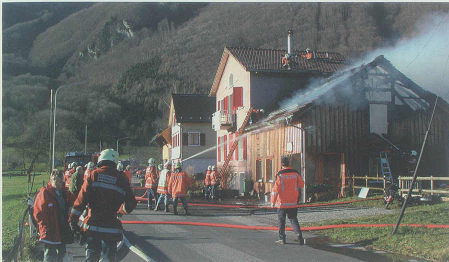
Die Alarmierung über Telefon 118, ein Alarmstufenplan, dem auch die Samariter angeschlossen sind, und eine gut organisierte Nachbarschaftshilfe stellen sicher, dass für jeden Ernstfall die erforderlichen Kräfte und Mittel möglichst rasch zum Einsatz gebracht werden können. Brandfall vom 1. Dezember 2002 in Frumsen.

Feuerwehr stehen und die ebenfalls Familie oder Beruf in den Hintergrund stellen, um anderen Hilfeleistungen zu erbringen.