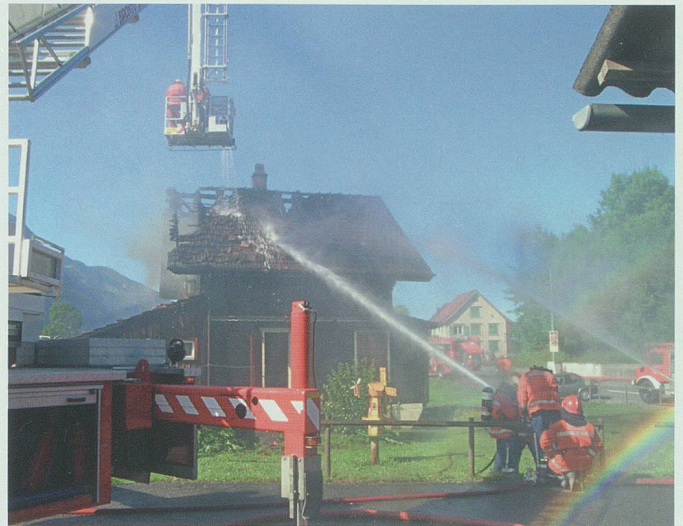
Der Hubretter der Feuerwehr Buchs wird in gemeindeübergreifender Zusammenarbeit auch regional für Rettungen und Lösch-einsätze eingesetzt wie hier am 20. Juni 2005 in Salez.