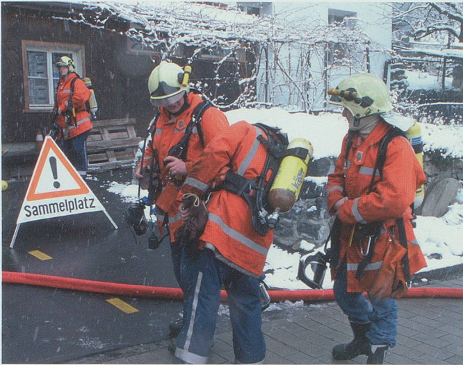
Die eigene Sicherheit der Feuerwehrangehörigen hat einen hohen Stellenwert: Löscharbeiten im Innern von Gebäuden werden heute nur noch mit Atemschutzausrüstung und hitzebeständiger Kleidung ausgeführt.