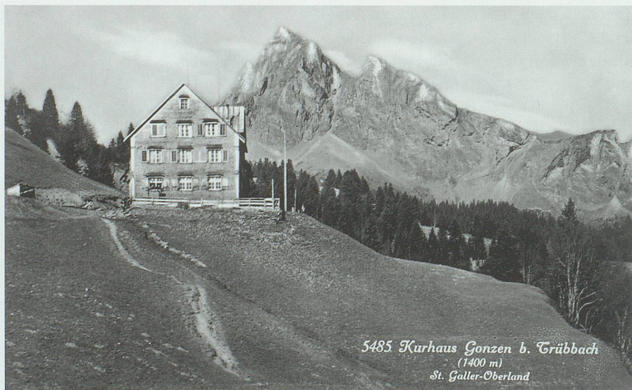
5485 Kurhaus Gonzen b. Trübbach (1400 m) St. Galler-Oberland