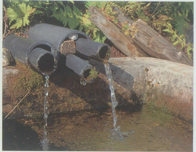
Die drei Einläufe aus den auf 1750 m ü. M. austretenden Federenquellen.

einer Tiefenausdehnung von 5 Metern mit Steinen besetzt und dementsprechend unterhalten werden.