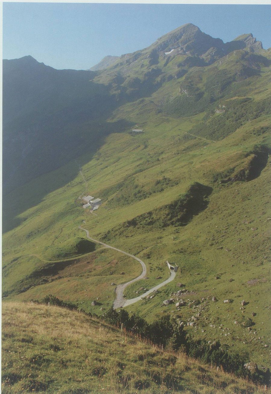
Imalschüel vom Altsess her. Vorne das Reservoir von 1988 des EWB auf Gams, links darüber die Alpegebäude des Undersess, rechts darüber der Rinderstall des Mittelsess.

In der Verleihung von 1985 ist für den Endausbau des EWB auf der Basis 1986 ein Wasserzins für 2961 kW zu 40 Franken oder total 118 440 Franken fällig. Davon fliessen 50 Prozent in die