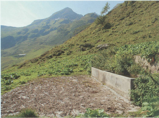
Auch der Mooseschlibrunnen ist mit einem befestigten Platz ausgestattet. Links hinten Imalschüel Mittelsess.