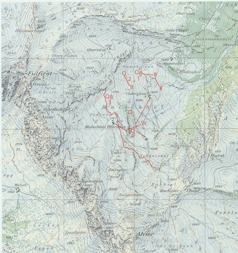
Quellen und Brunnen in Imalschül: 1 Gamsquellen, Brunnen auf Gams und Leitungsstrang zu den Brunnen bei der alten Hütte und beim Brentenplatz; 2 Mooseschliquelle und -brunnen; 3 Federquellen und -brunnen; 4 Widderquellen mit Fassung und Leitungsnetz zum Widder (W) und zum Ober-, Mittel- und Undersess. Die rote Linie markiert die Höhenquote 1750 m ü. M., die Obergrenze der Quellaustritte. Reproduziert mit Bewilligung von swisstopo (BA081630)