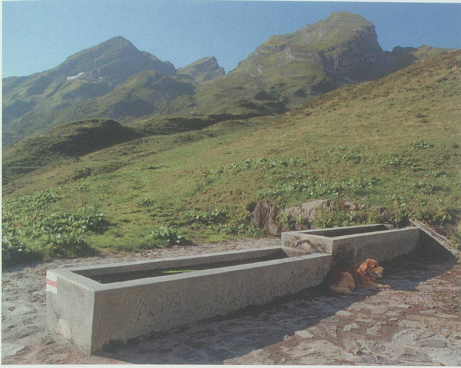
Federenbrunnen mit – zwecks Grundwasserschutz – befestigtem Platz. Hinten (von links) Alvier, Chli Alvier und Chrummenstein.