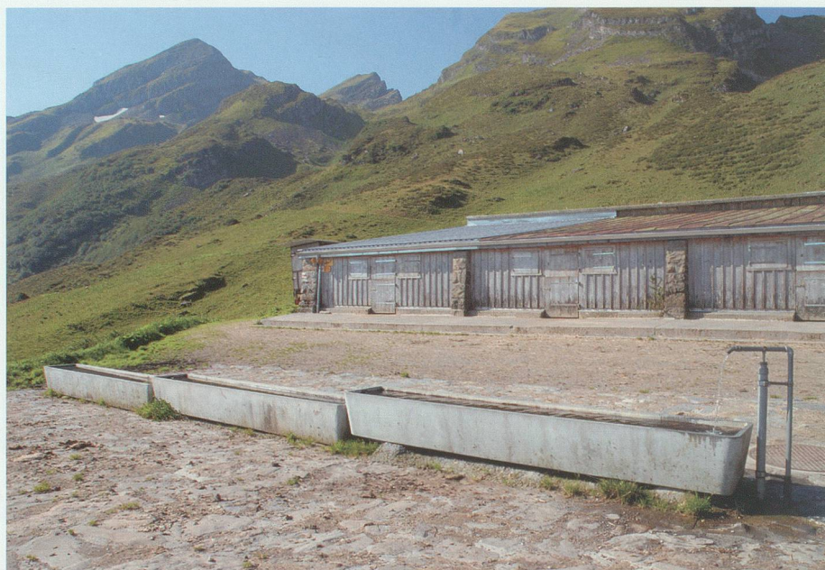
Das Obersess erhielt erst 1949 fliessendes Wasser. Die Befestigung des Brunnenplatzes und die drei Tröge wurden bei Aufnahme des Pumpenbetriebs 1993 erstellt.

telsäss und auch das Malschüeler Obersäss gespiesen. Ein Benzinmotor mit Pumpanlage drückt das Wasser in die obere Region hinauf.»