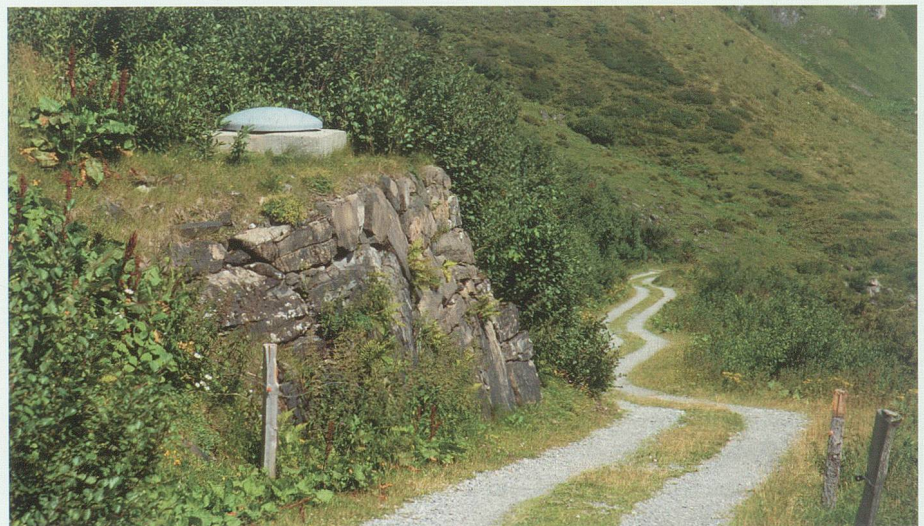
Widderquell-Fassung des EWB von 1990. Der Widder von 1957 befand sich etwa 30 Meter tiefer rechts unten.

«1931, Bauvorschriften und Vertragsbedingungen für das Erstellen einer Wasserleitung vom Federenbrunnen gegen die Hütte Malschüel Obersäss der Ortsgemeinde Buchs.» – Es wurde eine Leitung