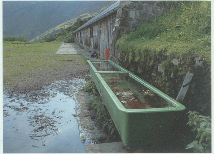
Der vordere der beiden im Jahr 1951 erstellten Brunnen beim Imalschüeler Mittelsess.

zu beachten, dass der Wasserbedarf im Obersess in früherer Zeit um einiges geringer war als heute, da damals in der Obersesszeit ausschliesslich Sauerkäse hergestellt wurde. Somit wurde das Melk- und Käsezeigeschirr mit der Schotte gereinigt. Das war für die Sauerkäseproduktion ausreichend und üblich, weil die Milch, die ja brechen musste, auf diese Weise bereits in den Eimern und Brenten mit der Bakterienkultur geimpft wurde. Wasser musste demnach also hauptsächlich für den Bedarf des Personals herbeigetragen werden, während das Vieh selbst die Brunnen aufsuchte.