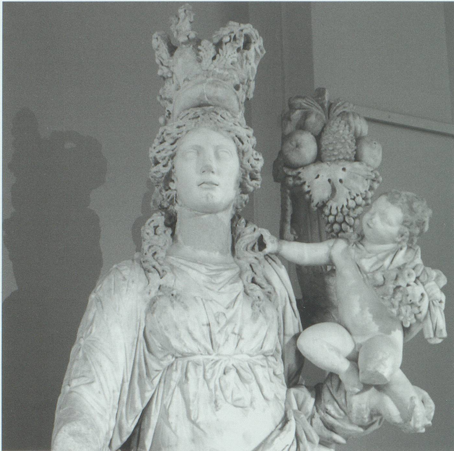
Tyche oder Fortuna als Glücksgöttin vermittelte den Menschen Reichtum und Segen. Griechische Statue im Archäologischen Museum Istanbul.

Dabei gewinnt der antike Ansatz in der Gegenwart wieder an Bedeutung: «In der Orientierungskrise einer nihilistischen und mit der Orientierung an einer utilitaristischen Einstellung aber ist Philosophie als Lebenskunst und als Reflexion auf Bedingungen eines guten, gelingenden, schönen, bejahenswerten (und nicht ausschliesslich moralisch glückswürdigen) Lebens wieder dringend und die Durchgestaltung individuellen Glücks aufs Neue lebendig geworden.» 51 In diesem Sinn verstehen sowohl Maximilian Forschner und Wolfgang Janke ihre historisch ausgerichteten Untersuchungen als Beiträge für eine aktuelle philosophische Diskussion um das Glück der Menschen.