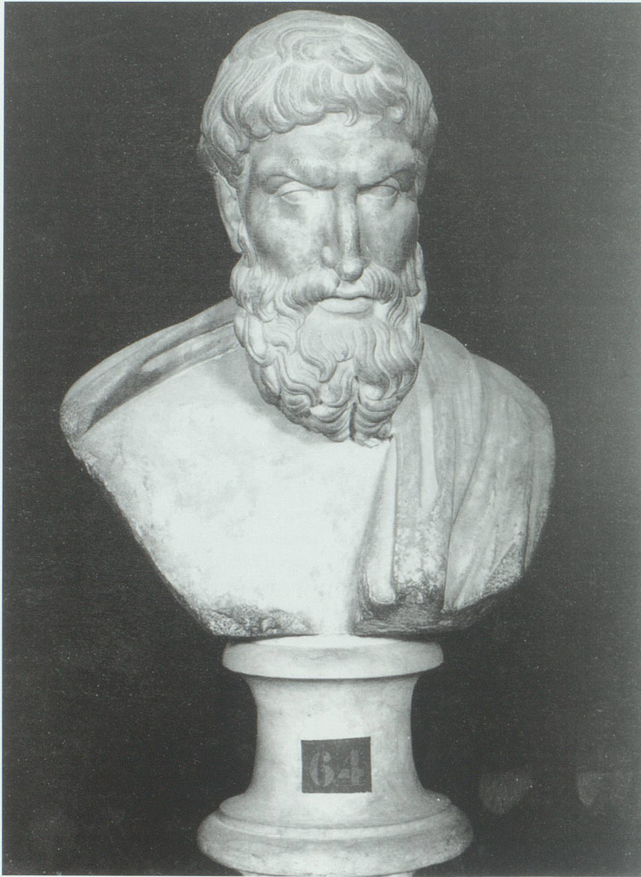
Der Philosoph Epikur entwickelte eine Glückslehre auf der Grundlage von Lust am Leben. Büste im Kapitolinischen Museum Rom.

mals sie zu seinen Göttern machen oder auch nur zu wichtig in ihren Meinungen, Anforderungen und Urteilen nehmen, sie nicht richten und sich von ihnen nicht richten lassen. Das beste Mittel, um mit der Welt stets zufrieden zu sein, ist, von ihr nicht viel zu erwarten, sie niemals zu fürchten, auch in ihr (allerdings ohne Selbsttäuschung) das Gute zu sehen und das Böse als etwas Unkräftiges, nicht Ausdauerndes zu betrachten, das sich in kurzem selbst vernichtet.» 66