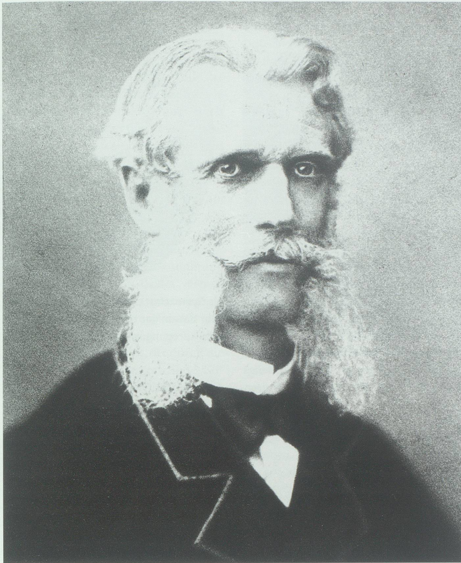
Als gereifter Mann und bekannter Professor veröffentlichte Carl Hilty seine ethischen Schriften. Aus Hilty 1949

Im gleichen Jahr, in dem das erste Jahrbuch erscheint, schreibt Hilty einen Aufsatz für die Bündner Seminarblätter mit dem Titel 'Die Kunst des Arbeitens' , ein Jahr später einen Aufsatz und Kommentar zur Übersetzung des 'Handbüchleins der Moral' des stoischen Moralphilosophen Epiktet. Darauf folgt 1889 'Wie es möglich ist, ohne Intrige, selbst in beständigem Kampf mit dem Schlechten durch die Welt zu kommen' ; in den 'Schweizerischen Blättern für erziehenden Unterricht' erscheint im gleichen Jahr die Abhandlung 'Glück' .