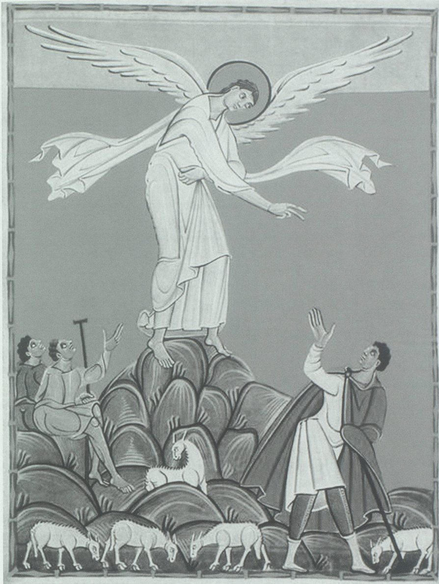
Christliche Vorstellung siedeln das Glück in einem jenseitigen Dasein an. Engelsverkündigung an die Hirten. Perikopenbuch Heinrichs II.

Frage nach dem Glauben an Gott aufgeworfen, dessen Vorstellung nicht einfach aus den Gesetzen der Natur oder des Kosmos herausgelesen werden kann, weil «ein solcher Naturgeist der menschlichen Seele und ihren tiefsten Bedürfnissen» nicht entspricht. Diese sucht nach Gerechtigkeit, Geduld, Barmherzigkeit, Liebe, denn «die Natur kennt kein Erbarmen; sie schützt das Starke und zerstört das Schwache», und der aus der Naturbetrachtung entstehende Pantheismus führt zur Verehrung des