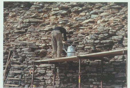
10. April 2008: Für die Reinigung des Gemäuers (hier der Innenseite der Schildmauer) werden Staubsauger verwendet.