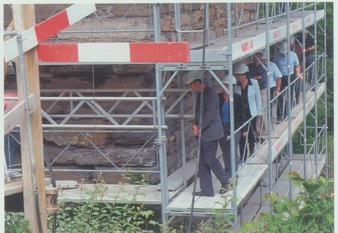
18. Juni 2008: Im Gänsemarsch begeben sich die Teilnehmer der Denkmalpflegeexkursion aufs Baugerüst des über zwanzig Meter hohen Turms.