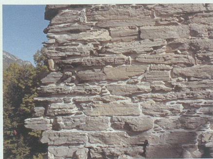
5. Oktober 2008: Die ausgefugten Mauern werden der Burgruine nun wohl für die nächsten fünfzig Jahre Halt und Sicherheit geben.

12. September 2008: Der Bergfried ist abgerüstet und die Schildmauer aussen