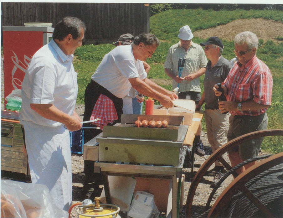
28. Juni 2008: Fürs leibliche Wohl der Baustellenbesucher sorgten die Gamser Hobbyköche «Salz & Pfeffer».

● Ab Montag, 1.9.2008, Bergfried ganz abgerüsten. Eingerüstung der Aussen- seite der Schildmauer fertig bis 5.9.2008. In dieser Woche ist der Baumeister noch auf der Innenseite der Schildmauer beschäftigt.