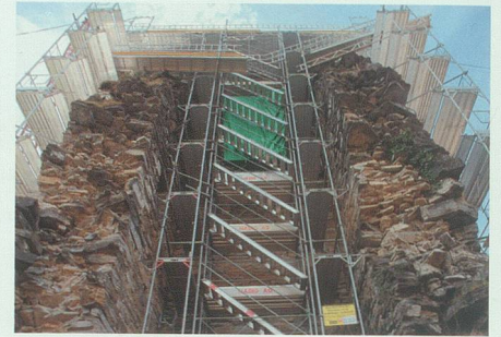
10. April 2008: Zur Stabilisierung des Baugerüsts haben sich die Gerüstbauer eine spezielle Konstruktion einfallen lassen.