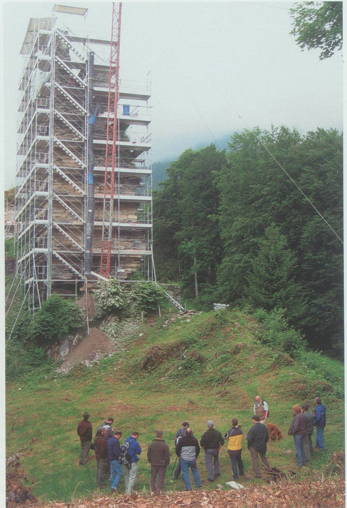
14. Juni 2008: Am Behördentag der Forstgemeinschaft Sennwald lassen sich Ortsverwaltungsräte, Forstdienst und Jägerschaft über die Geschichte der Burg und die Sanierungsarbeiten orientieren.