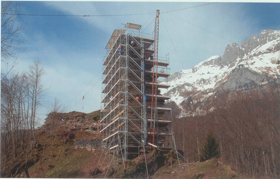
10. April 2008: Der Bergfried ist eingerüstet und die Kippmast-Krananlage erstellt.

16. April 2008: Die Grobreinigungsarbeiten am Bergfried und an der Innenseite der Schildmauer sind weit fortgeschritten. Die Baustelleninstallation ist komplett fertiggestellt. Archäologe Jakob Obrecht ist an der Schild-