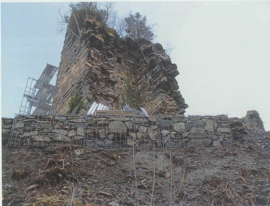
15. März 2008: Die Steinkörbe zur Sicherung des Burghofzugangs sind gesetzt und das Baugerüst ist im Bau.

rund hundert Meter lange Baupiste eingekoffert und am Fuss des Burgfelsens ein Installationsplatz eingerichtet. Unmittelbar daneben wurde eine Felsrippe abgeholt, die für die Gewinnung der für die Sanierungsarbeiten benötigten Steine diente – ein Verfahren der Materialbeschaffung, das schon beim Bau der Burg vor achthundert Jahren zur Anwendung gekommen war. Um den Zugang zum Burghof zu ermöglichen, war bis unter den Bergfried zudem ein teils mit Steinkörben befestigtes Wegtrasse zu erstellen.