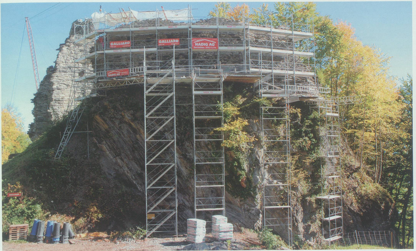
5. Oktober 2008: Auch die Eingerüstung der Schildmauer präsentiert sich als eindruckliches temporäres Bauwerk.