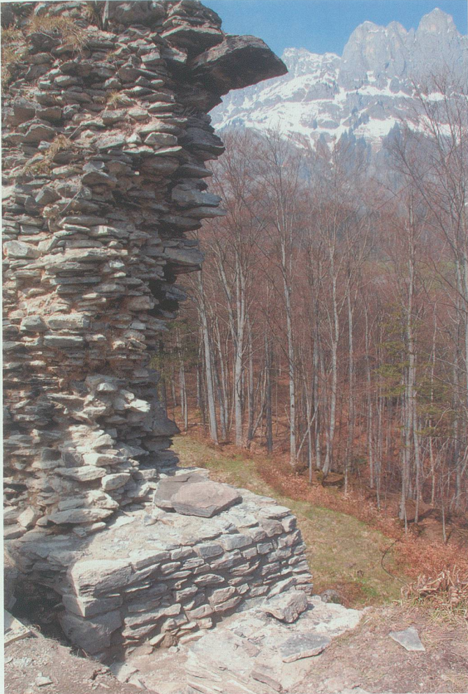
18. April 2008: Der Baumeister hat erste Ausfugungsarbeiten am Nordende der Schildmauer als Muster erstellt. Im Vordergrund unten eine freigelegte Fensteröffnung eines verschütteten Stockwerks.