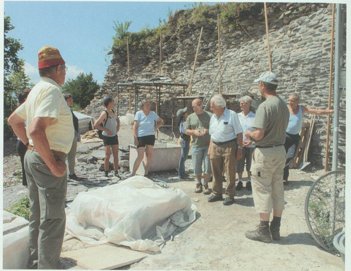
28. Juni 2008: Am «Tag der offenen Burgruine» nutzen zahlreiche Interessierte die Gelegenheit zu einer geführten Baustellenbesichtigung.

mauer wie auch am Bergfried mit Grobreinigungs- und Zeichnerarbeiten beschäftigt. Der Baumeister hat erste Ausfugungsarbeiten am Nordende der Schildmauer als Muster erstellt. Im Weiteren macht er Feinreinigungsarbeiten an vom Archäologen freigegebenen Mauerflächen.