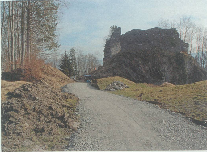
25. Februar 2008: Die Baupiste ist erstellt. Sie wird nach Bauabschluss wieder begrünt werden.