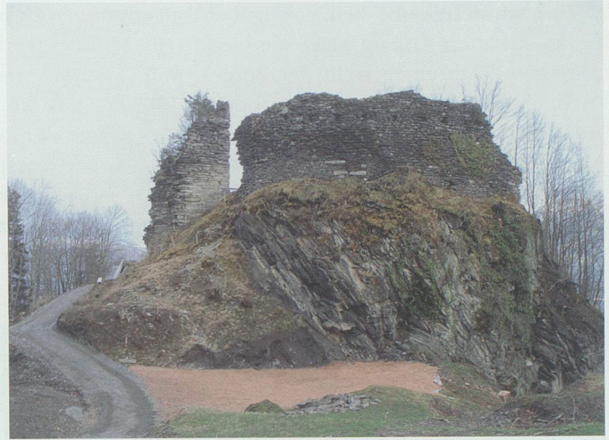
15. März 2008: Der Installationsplatz und das Wegtrasse bis unter den Bergfried stehen bereit.

Mai 2007 das Baugesuch einreichen und im Herbst gleichen Jahres bereits Vorbereitungsarbeiten für die auf 2008 geplanten Hauptarbeiten ausführen lassen. 1