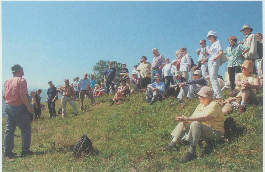
Die Sommerexkursion von «Archäologie Schweiz» vom 21. bis 23. Juni 2008 führte unter anderem auf den Ochsenberg bei Gretschins.

«Drei Länder – ein Kulturraum: das St.Galler, Liechtensteiner und Vorarl- berger Rheintal»: Das war das Motto der Generalversammlung im Schloss Werdenberg und der Sommerexkur-