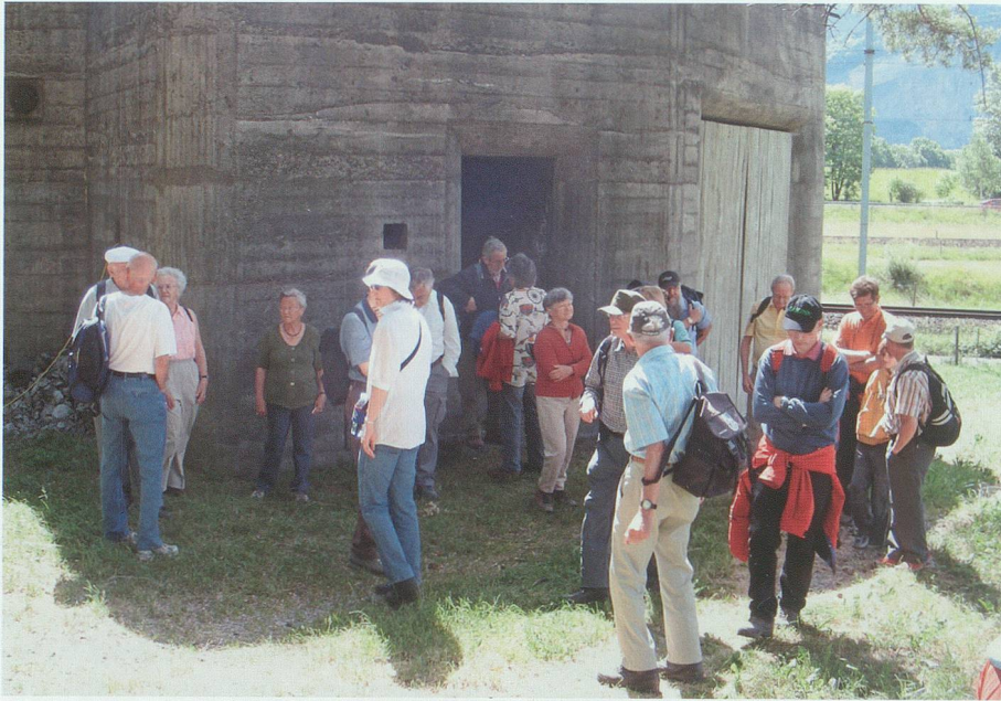
1. Juni 2008: An der militärhistorischen Exkursion «Wehrraum Werdenberg-Sargans im Zweiten Weltkrieg» interessierten auch die zahlreichen Aussenanlagen.

museums Schlangenhaus wird sie ihren Einsatz für die kulturellen Anliegen unserer Region weiterhin fortsetzen.