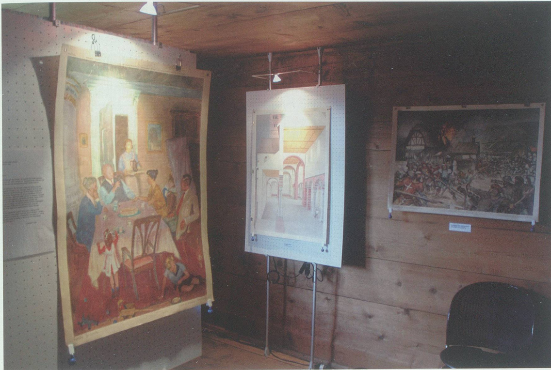
Erinnerung an vergangene Schulstunden und wertvolle Zeitdokumente: Schulwandbilder aus der Zeit von 1935 bis 1995 waren Thema der Sonderausstellung 2008.