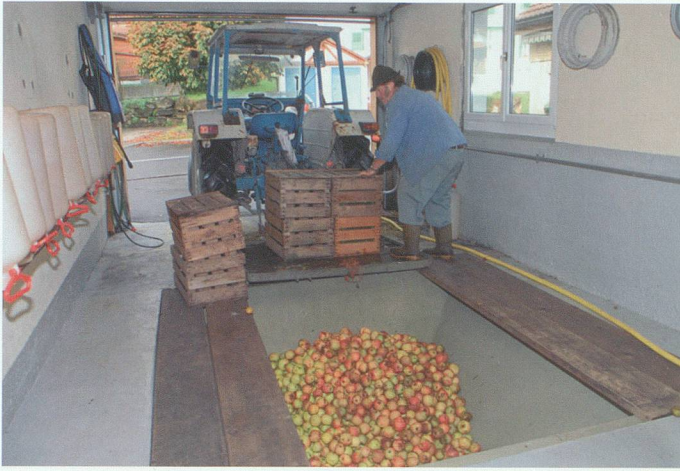
Anlieferung von Mostobst im Herbst 2009 in Sax. Ist das Obst im Schacht, läuft die Verarbeitung automatisch.