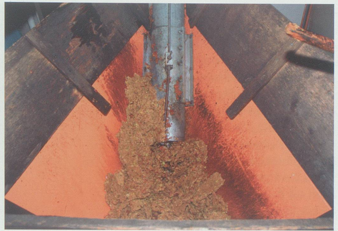
Der nach dem Pressvorgang anfallende Trester findet als Tierfutter Verwendung.

wähnt. Üblicherweise wird der Most noch heute nicht aus den modernen Apfelsorten hergestellt, da diese auf viel Fruchtzuckergehalt gezüchtet sind. In der Kelterung greift man deshalb auf die säurehaltigeren älteren Sorten aus dem Streuobstbau der hochstämmigen Bäume zurück.