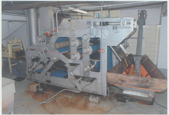
Obstmühlen (vorne rechts) und Mostpressen (hinten) ähnlicher Bauart standen einst in den meisten Werdenberger Dörfern. Laur 1947