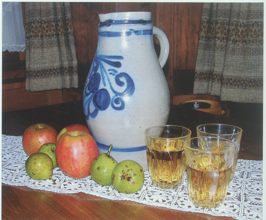
Zum Ausschank von Most wird der Henkelkrug aus Südhessen auch in unserer Region verwendet. Der «Steingut-Bembel» zeichnet sich aus durch die Salzglasur in hellgrauer Farbe und das kobaltblaue Muster.

derts fest, der Most sei früher weniger stark getrunken worden als gegenwärtig, so dass eine Person zwei bis drei Liter zu sich nehmen konnte, ohne berauscht zu werden. Häufig wurde nämlich der Trester nach der Pressung in einer «Luurgelta», einem grossen Holzbottich, mit Wasser angesetzt. Am folgenden Tag erfolgte eine zweite Pressung; er wurde «glüürt», wie man sagte. Den reinen, vergorenen Saft verdünnte man je zur Hälfte mit dieser «Luur» und trank ihn so. 5 Es dürfte den Leuten jedoch kaum bekannt gewesen