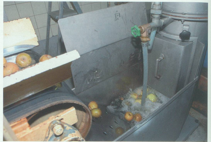
Per Förderband gelangt das Obst in die Waschanlage und danach in die Mühle.

mit denen der Luftzutritt und die Bildung von Essigsäure unterbunden werden konnte. 11