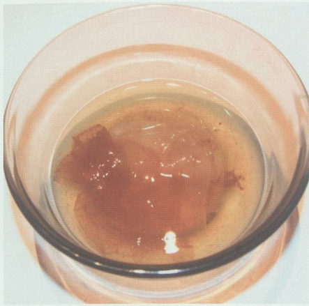
Abgeseibte Essigmutter: Die gallertartige Masse aus Essigsäurebakterien bildet sich, wenn man leicht alkoholhaltige Flüssigkeiten längere Zeit stehen lässt. Sie fermentiert Alkohol mit Hilfe von Sauerstoff aus der Luft zu Essigsäure.