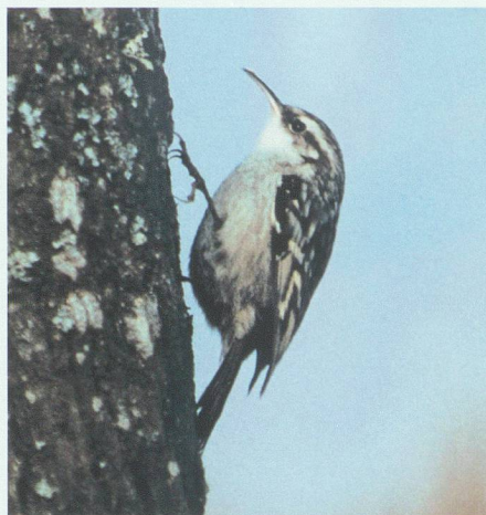
Wo Obstbäume vorhanden sind, ist meist auch der Gartenbaumläufer anzutreffen. Das Nest wird in Rindenspalten und hinter abstehenden Rindenteilen angelegt, die Art brütet aber auch in Nistkästen.

Obstgärten gibt, diese aber erst in den letzten 200 bis 300 Jahren zum flächenmässig bestimmenden Landschaftselement wurden. Das fiel, wie oben ausgeführt, in eine Zeit, als der Raubbau in den Wäldern ein starkes Ausmass erreichte, die Vogelarten jedoch in den Obstgärten einen Ersatzlebensraum fanden. Die Zeitspanne von rund 200 Jahren war andererseits zu kurz, als dass sich Anpassungen an die Nutzung dieses Habitatstyps oder mögliche Habitat-traditionen hätten aufbauen können. Es ist dies womöglich auch der Grund, weshalb Hilfsstrukturen wie Feldgehölze im Bereich des Obstgartens eine so grosse Bedeutung haben. Der Verlust von Hochstammobstbäumen wäre deshalb verkräftbar, wenn derartige Hilfsstrukturen gezielt angelegt würden.