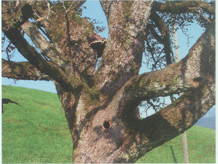
Für Höhlenbrüter besonders wertvoll sind Obstbäume mit einem Astloch, Vertiefungen und Rindenspalten. Hinter diesem runden Höhleneingang hat wohl ein Star seine Jungen grossgezogen.

Wie der Wald wirken auch Obstwiesen ausgleichend auf das Klima. Das