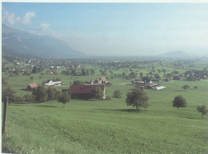
Im Gebiet Banholz an der Gemeindegrenze zwischen Grabs und Gams wurde eine Probefläche ausgeschieden, um die Brutvogelfauna zu erheben. Es gibt zwar noch Obstbäume im Gebiet, doch hat sich auch hier der Obstbaumbestand stark ausgedünnt.

Besonders augenfällig ist der prägende Einfluss eines Obstgartens auf das Landschaftsbild. Im Vergleich zu den vorwiegend flächigen landwirtschaftli-