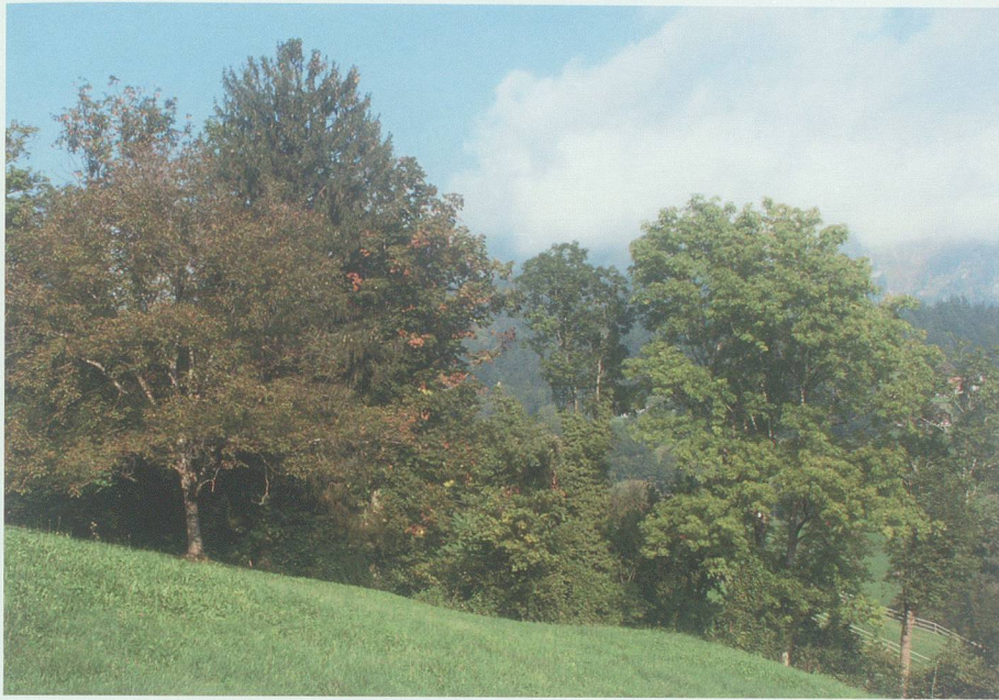
Neben den Obstbäumen spielen weitere Strukturen wie hier ein Feldgehölz in der Probefläche Steffelisbünt bei Grabs eine sehr wichtige Funktion für das Vorkommen von Vögeln und anderen Tieren.

des Werdenbergs präsentiert, wurde für den vorliegenden Aufsatz eine Brutvogelkartierung in einem entsprechenden Lebensraum durchgeführt. Schwierigkeiten bereitete die Evaluation eines geeigneten Obstgartens. Es muss mit Wehmut festgestellt werden, dass es im Jahr 2009 in unserer Region nicht mehr möglich war, eine intakte, ausgedehnte Feldobstwiese, möglichst mit extensiver Unternutzung, zu finden. So musste auf einen Obstgarten zurückgegriffen werden, der zwar noch einzelne stattliche, schöne Obstbäume aufweist, die sich aber nicht als Einheit präsentieren, sondern in sehr aufgelöstem Verband verteilt auf rund 65 Hektaren Fläche stocken.