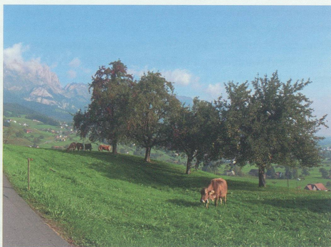
In den Hanglagen des Leversberg wurden wie im angrenzenden Talgebiet die Brutvögel erfasst. Auch hier gibt es kaum mehr geschlossene Obstbestände, doch noch vorhandene Feldgehölze bereichern diesen Lebensraum und bieten verschiedenen Vogelarten Brutraum.