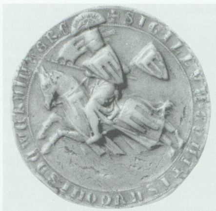
Reitersiegel Hugo I. von Werdenberg mit Lanze (1270–1284): + SIGILLVM. COMITIS. HVGONIS.DE.WERDINBERG.