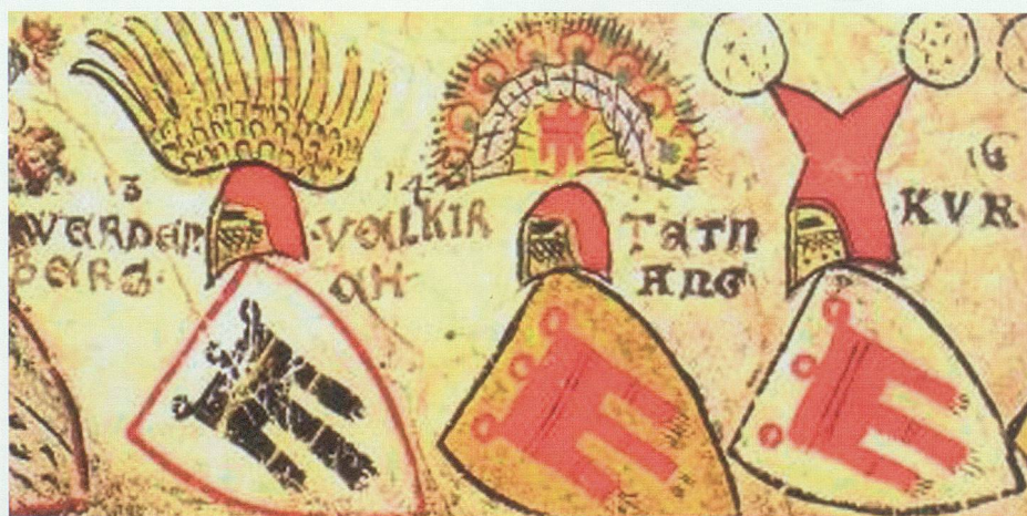
Die Wappen der Grafen von Werdenberg, Montfort-Feldkirch und Montfort-Tettang (mit Beutelstand) in der Wappenrolle von Zürich, um 1340. Schweizerisches Landesmuseum, Zürich

1234 nicht allein über Lehen von Montforter Dienstleuten verfügen und schon erbberechtigte Kinder haben, denn sein ältester Sohn nahm noch 1298 an der Schlacht von Göllheim teil und starb erst 1302. Hugo I. von Montfort kann also nicht vor 1234, muss aber vor dem ersten gemeinsamen Auftritt seiner Söhne 1237 gestorben sein; am 12. März ist er im Totenbuch des Klosters Mehrerau als Graf von Bregenz und im Jahrzeitbuch der Johanniter von Feldkirch als Gründer des Hauses verzeichnet. Sein älterer Sohn Rudolf war 1243 ohne seinen Bruder zweimal in Begleitung seines Schwagers, des Freiherrn Walter IV. von Vaz: im Februar in Süditalien am Hof Kaiser Friedrich II. und im August in Chur an der Spitze des rätischen Adels. Um 1244 dürfte auch er gestorben sein, denn 1245 6 trat sein jüngerer Bruder Hugo am Hoftag des Stauferkaisers in Verona auf. Mit der Werdenberger Linie begründete Rudolf I. die älteste Linie der Grafen von Montfort.