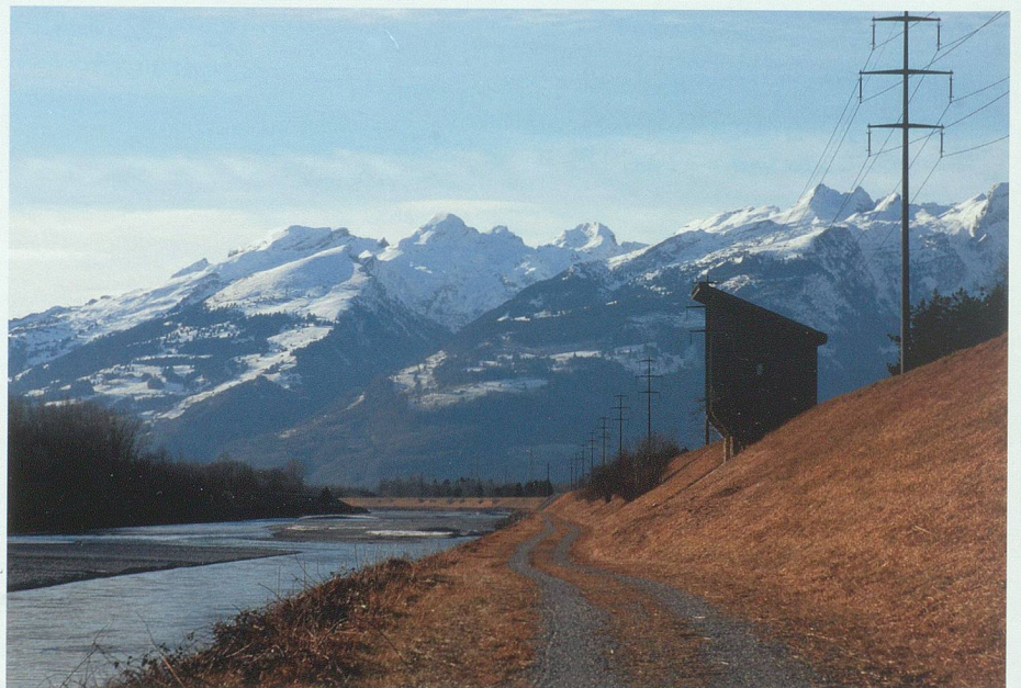
Einer der letzten Zeugen: Das Häuschen der einstigen Salezer Kolmationsschleuse dient heute als Wasserstandsmessstation.

Die einzige Scheidewand dieser Wassermasse, die 1868 über 100 000 Cubikfuss pro Secunde lieferte, und dem Hinterland bildet das Wühr, ein Kiesdamm von 12 Fuss Kronenbreite mit 1½ füssigen Böschungen und rheinseits 2–2½ Fuss dick mit Steinen verkleidet. Die hinten liegenden alten Wühr und Dämme fallen, weil niedriger als die neuen Wühr, völlig ausser Betracht. Es ist klar, dass diese Hochwühr, obschon die Plattform 2 Fuss über dem höchsten Wasserstand von 1868 liegt, Besorgniss erregend sind, indem bei allfälligem Bruch nicht bloss ein Theil des Rheins sein Bett verlässt, sondern die ganze Wassermasse sich mit furchtbarer Kraft über das Land ergiesst, dasselbe überschwemmt und verheert und erst mehrere