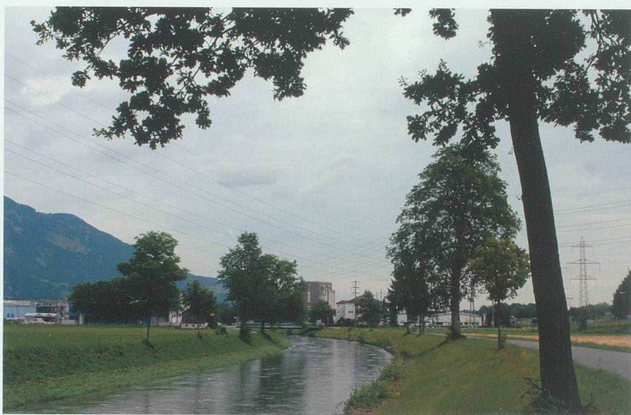
Derselbe Kanalabschnitt im Sommer 2010: Bei den Kanalbäumen ist der «Generationenwechsel» im Gang und nördlich der Brücke ist ein Industriegebiet entstanden.