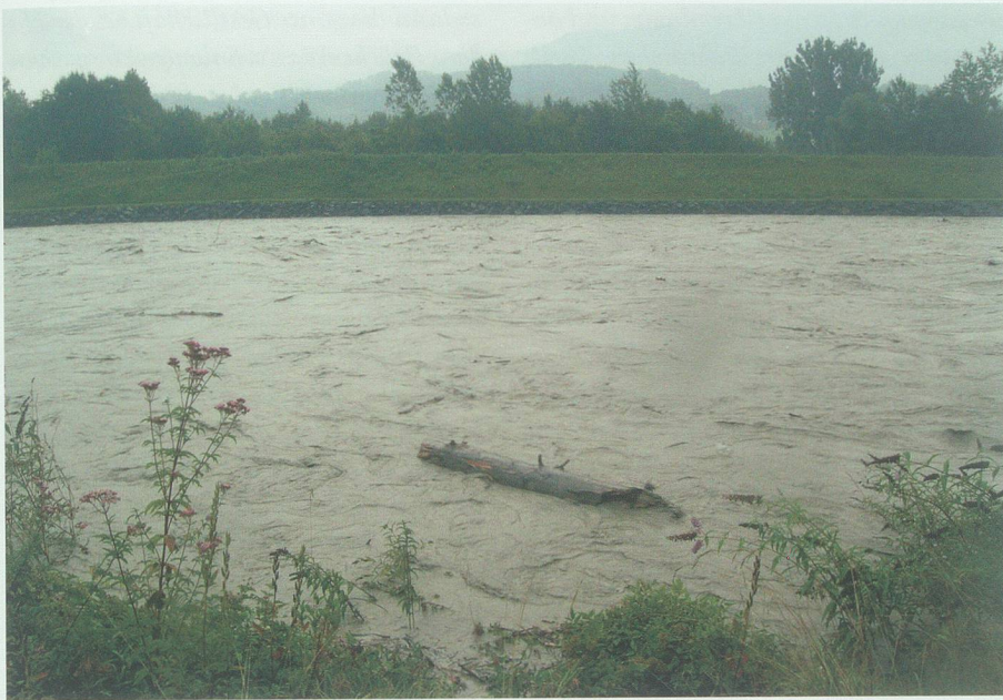
Kanalisierte «Wildbach»: Bei einem mittleren Hochwasser wie hier am 23. August 2005 wälzen sich im Alpenrhein pro Sekunde rund 1000 bis 1200 Kubikmeter Wasser talwärts. Bei den Hochwassern von 1927, 1954 und 1987 stieg die Abflussmenge auf über 2100 m 3 /sec.

Nachdem die Teilnehmer aus den Erklärungen des Herrn Wey und den vorgezeichneten Plänen einen Überblick über das wichtige Unternehmen erlangt hatten, stiegen sie an Bord der beiden bereitstehenden Schiffe um zum Anschauungsunterricht überzugehen. Das Admiral-Schiff war dank der Fürsorge des Admirals und der Gastfreundschaft der St. Gallischen Regierung gut armirt, reicher Proviant füllte die Räume und zahlreiche Batterien harren der Entladung; doch waren die Geschütze heute nicht gegen die stetigen Angreifer des Rheinbaupersonals gerichtet, sondern sollten nur gelegentlich einen durstigen Techniker in Grund bohren, was aber auch geschah dank der Solidität derselben und aus dem Grunde, dass eine erste tüchtige Ladung an das Flaggschiff abgegeben werden musste, die denn auch von dessen Insassen mit einem heldenmüthigen Hurrah aufgenommen wurde. Doch nun Anker gelichtet! Fest steht und treu der stramme Saxer 7 am Steuer, die buschigen Augenbrauen trutzig 15 cm weit in die Welt hinausrichtend und mit martialischem Gesichte, auf dem nur beim Gedanken an die Missgeschicke des engli-