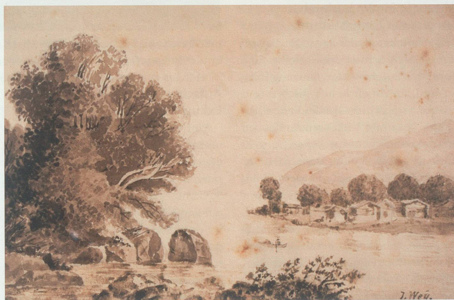
Zwei Aquarelle von Jost Wey, die auf ästhetisches Empfinden und Sensibilität für Natur und Landschaft schliessen lassen. Die Örtlichkeit der beiden Motive ist nicht bekannt. Im Staatsarchiv St.Gallen (StASG)

Mit der Zeit wird man es nicht nur dahin bringen, das Zwischenland zwischen Hochwuhrr und Binnendamm aufzufüllen, sondern man wird das innerhalb dem Binnendamm liegende Gemeindeländ complexweise abgrenzen und colmatiren, ja es ist uns vermöge des Gefälls die Möglichkeit gegeben, das Hinterland in einer bestimmten vom Gefäll abhängigen Entfernung von der Schleuse bis auf die neue Wuhrrhöhe aufzulanden.