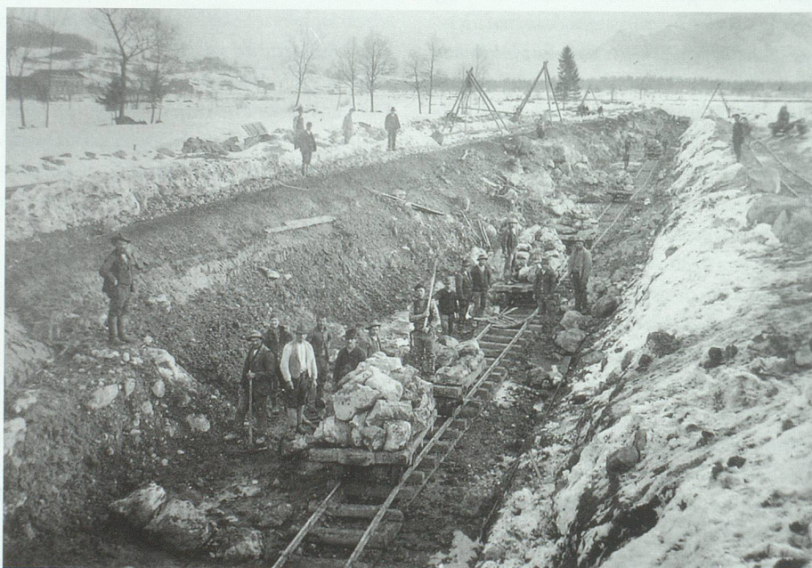
Bauarbeiten im Winter 1905/06 am obersten Abschnitt des Rheintaler Binnenkanals im Steinmad bei Sennwald.

Neben der Entsumpfung der Rheinebene war die Hauptaufgabe des Canals die Schliessung der Lücken im Hochwuhr zu ermöglichen, durch welche früher die verschiedenen Binnengewässer in den Rhein ausmündeten. Diese Lücken waren äusserst gefährlich, denn sie erlaubten den Hochwassern den Eintritt in die Niederungen an einer Reihe von Puncten und machten die Wirkung des Rheindammes zum Theil illusorisch.