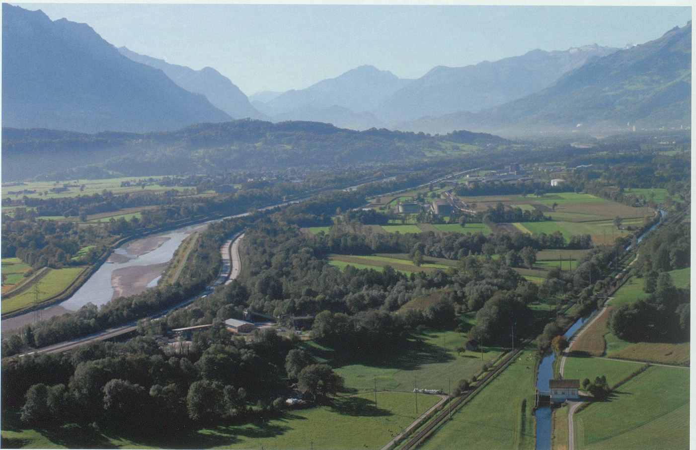
Jost Weys Rheintaler Wirkungsfelder auf einen Blick, aufgenommen im Schluch bei Lienz: Links der korrigierte Alpenrhein (im Übergangsbereich vom Hochwuh- zum Doppelwuhsystem), vorne rechts der Rheintaler Binnenkanal, darüber (links von der Eisenbahnlinie) der Werdenberger Binnenkanal. Luftaufnahme 2006, Hans Jakob Reich, Salez

namik des Alpenrheins im Tageslauf, im Jahreslauf und über die Jahrzehnte möglich. Wey bewährte sich als hervorragender Beobachter der Natur und nicht zuletzt als Kenner der Talgeschichte. Er wusste die Vorleistungen und Erfahrungsschätze anderer Wasserbautechniker kritisch zu würdigen und zu nutzen. Wasserbau ist ohne fundierte Sicht über weite Zeithorizonte