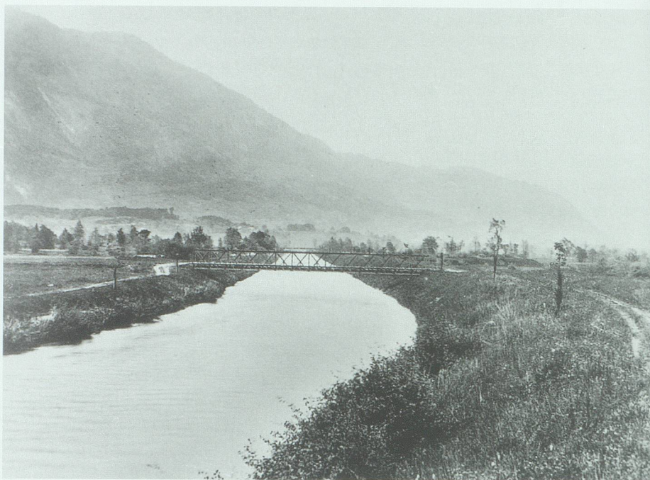
Der Werdenberger Binnenkanal bei der Brücke der Strasse Salez-Ruggell im Jahr 1895. Die von Jost Wey schon 1878 vorgesehene Baumbepflanzung ist ausgeführt. Bild im StASG

Beide Dämme sind von Zeit zu Zeit durch Querwuhre verbunden. Durch die Schlammablagerung wird bei Hochwasser der Boden zwischen den Dämmen erhöht und schliesslich mit Erlen etc. bepflanzt, so dass mit der Zeit zwischen Rhein und Niederung ein mit Wald bewachsener erhöhter Streifen entsteht, durch den das Hochwasser nicht mehr so leicht durchbrechen kann, als durch einen einzigen schmalen Damm. Die Hinterdämme beste-